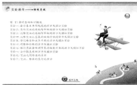
图 1-2 基础会计实验内容