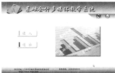
图 1-1 基础会计多媒体教学系统