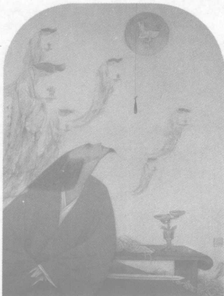
卧薪尝胆的越王勾践，有着超强的自我力量