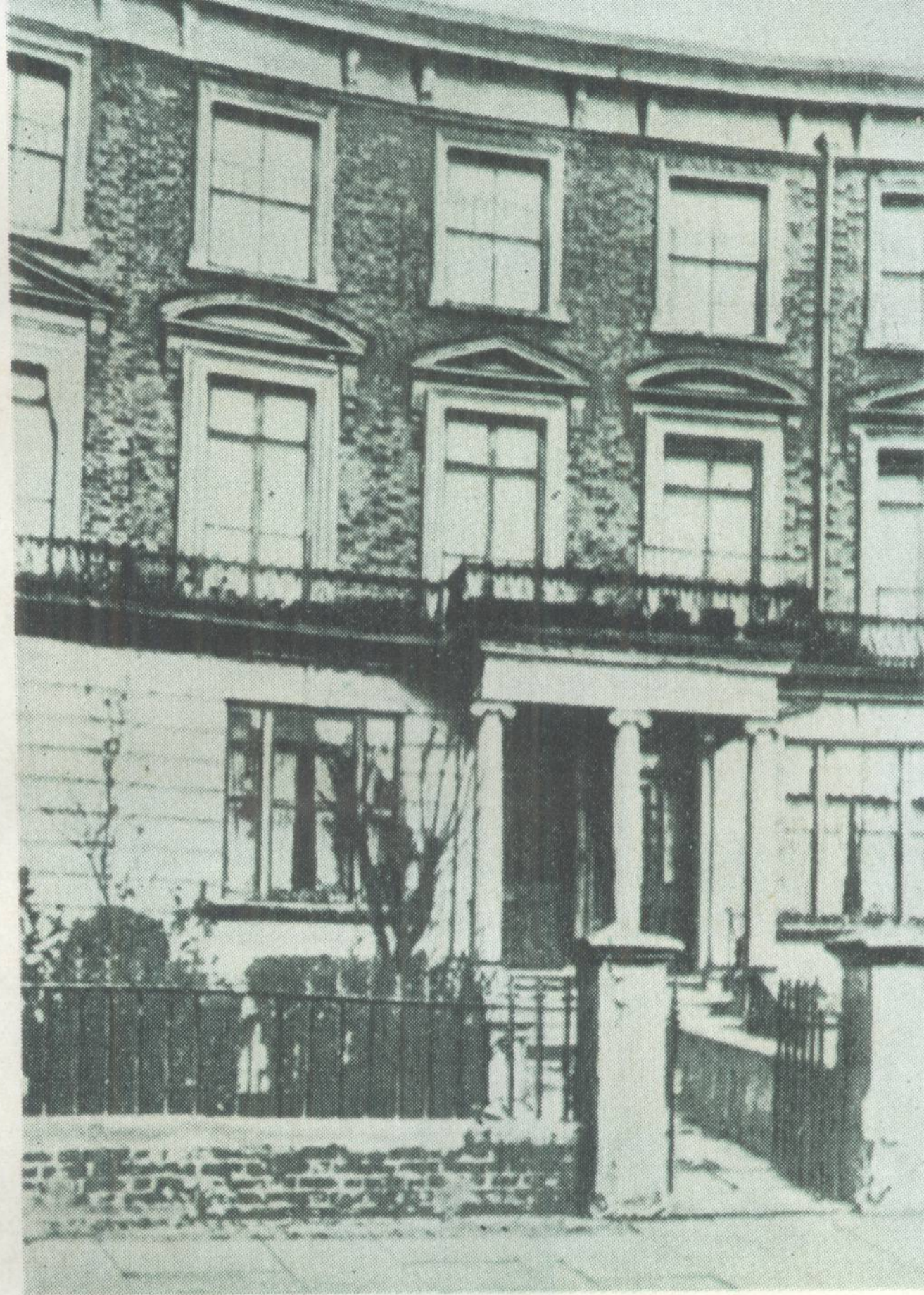
伦敦梅特兰公园 41 号 马克思家(从1875年——逝世止)