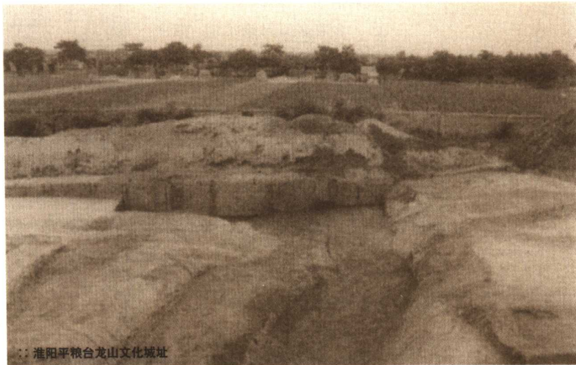
：淮阳平粮台龙山文化城址

从神话和民俗学角度来考察箕子入朝鲜之事，似乎也能作出一定的解释。古代黄海、渤海沿岸，属于东夷地区；而商族活动区和朝鲜半岛地区，便是属于这个区域。在神话传说中，东夷族应该都是“卵生”的部族，如同《诗经》里所传唱的，“天命玄鸟，降而生商”。实际上也就是以鸟为图腾，作为部族的崇拜物。正因此，古代东夷族在自己的发展过程中，自然形成了一些共同的民