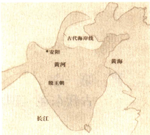
：殷商时期的中国 殷商时期的势力以黄河流域为中心，其影响波及到东南和长江附近。

断，早在中国的春秋战国时期，古代吴越一带先民，就可能有一些人从海上来到日本列岛，这大概是日本最早的中国移民。徐福东渡的传说，实际上是秦汉之际中国人渡海移民到日本的一个缩影。文献明确记载中日之间的友好往来，当在