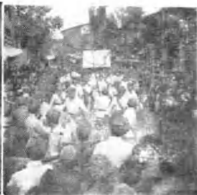
↑南工团三分团一大队分配去47军的同志进入湖南零陵