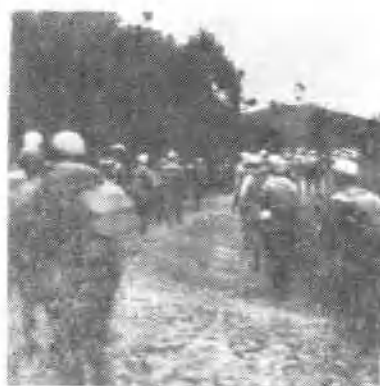
↑1949年10月，南工团二分团由江西经大庾岭向广东进军