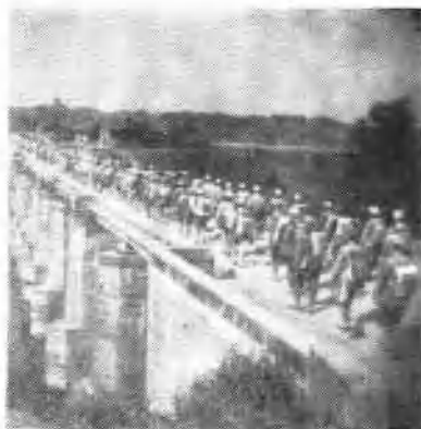
↑南工团三分团一大队在湖南的行军途中