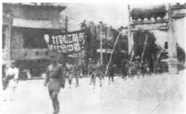
↑1949年7月18日，南工团一分团赴先农坛体育场参加欢送大会