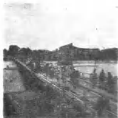
↑1949年9月，南工团二分团进军江西信丰开展宣传工作