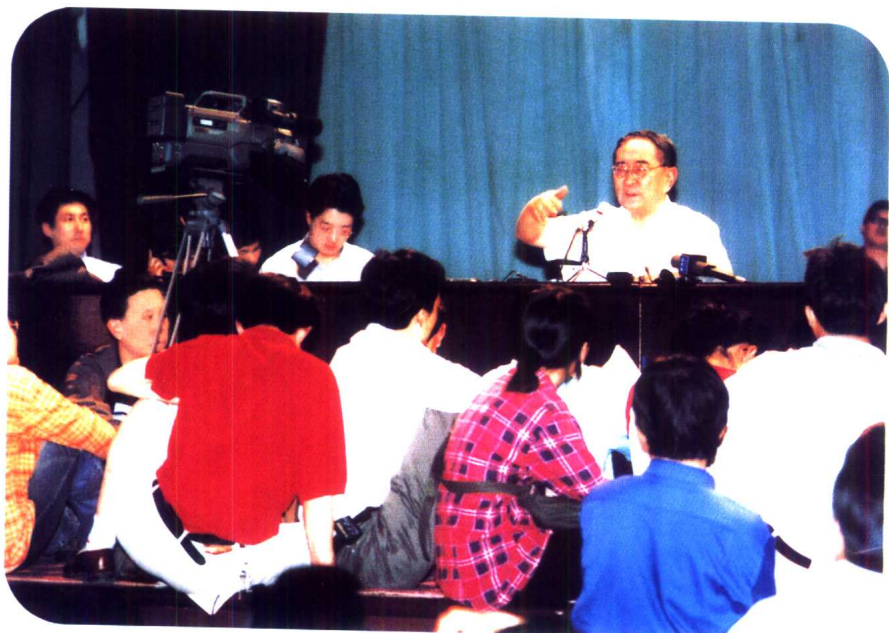
连讲桌前面的空隙也坐满了人