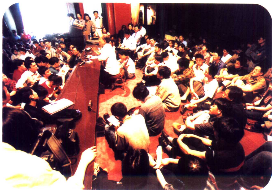
电教楼报告厅讲台上席地而坐的听众