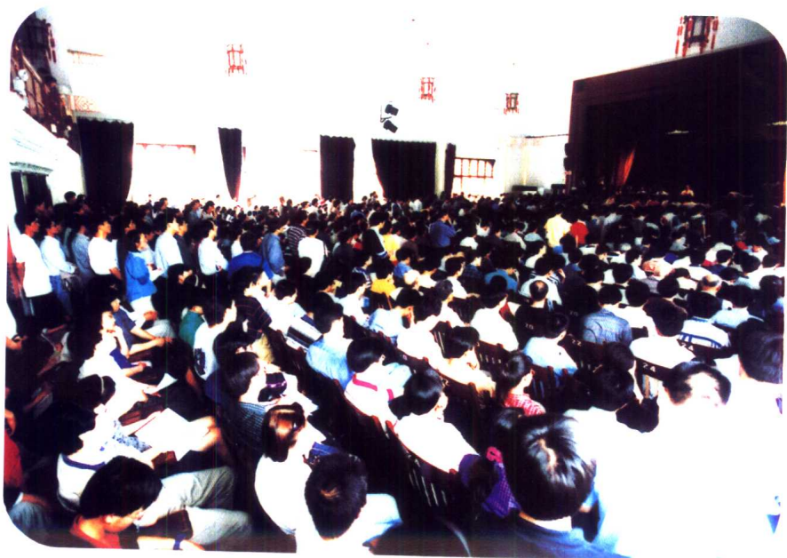
办公楼座位有限，所有的过道都挤得水泄不通