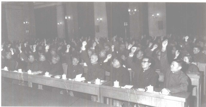
党的十一届三中全会会场

社会主义在中国，是历史的选择、人民的选择。由于我国是在半殖民地半封建社会的基础上完成了由新民主主义到社会主义的过渡，