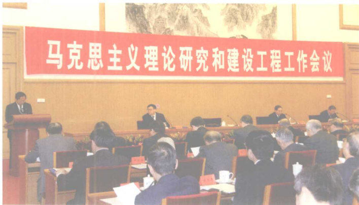
马克思主义理论研究和建设工程工作会议