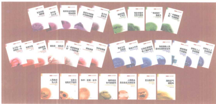
学习宣传党的十七大的图书琳琅满目

中国特色社会主义理论体系之所以完全正确，之所以能够引领中国不断发展进步，最根本的就在于它既坚持了马克思主义基本原理，又注重结合中国实际，深刻把握我国基本国情及其经济社会发展的阶段性特征，反映了我国社会进步的新要求和人民群众的新期待，有着鲜明的实践特色；深深地扎根中国土壤，把马克思主义真理的力量熔铸在民族的生命力、创造力、凝聚力之中，有着鲜明的民族特色；顺应时代潮流，把握时代脉搏，反映时代要求，有着鲜明的时