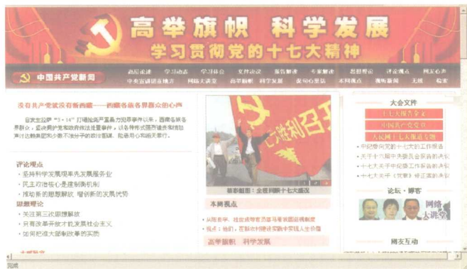
人民网开设的“学习贯彻党的十七大精神”专题