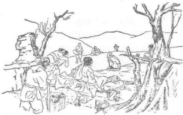
失去土地的农民成为无家可归的游民