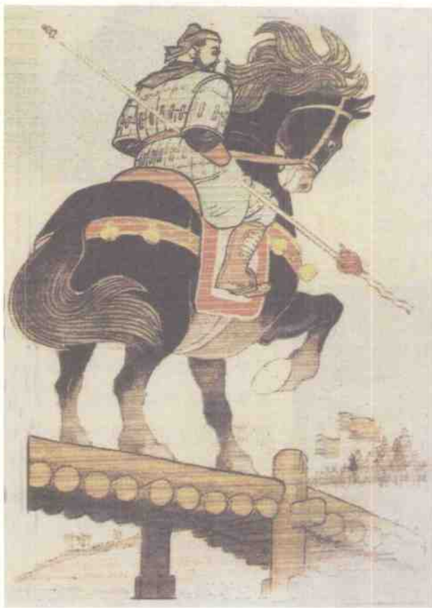
张飞长坂坡据水断桥

毛泽东对中国历史特别是三国历史关注颇多。他在自己的著作和讲话中,对三国历史上的许多人物都作过评价。作者同大多数为中国革命事业奋斗过的同志一样,曾经虔诚地跟着毛泽东的旗帜前进。毛泽东对历史人物的评价,曾经是作者努力学习和研究历史的指针。本书就是以毛泽东对历史人物的评价