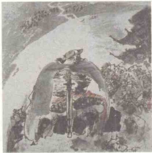
天下英雄谁敌手？曹刘。 生子当如孙仲谋。

需要说明的是，一定会有这样的情况，尽管作者有运用马克思主义历史科学的原理去正确评述历史人物的愿望，但由于各