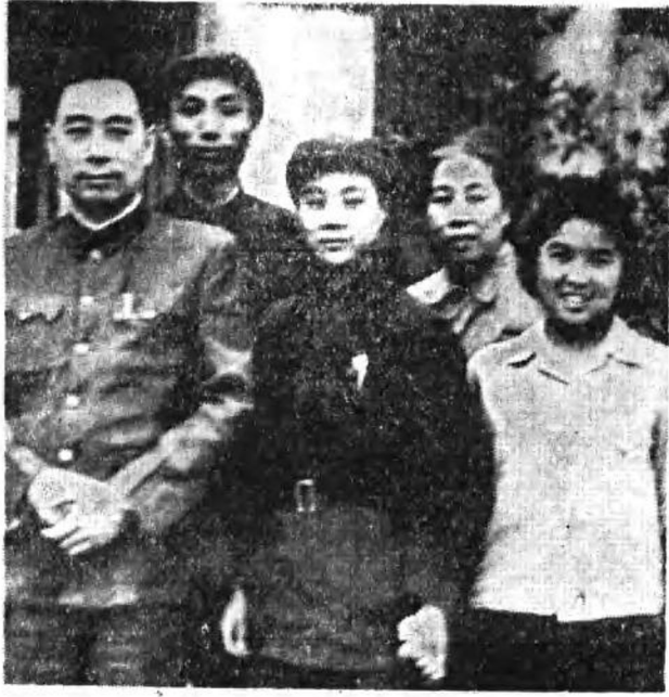
与周恩来总理在一起