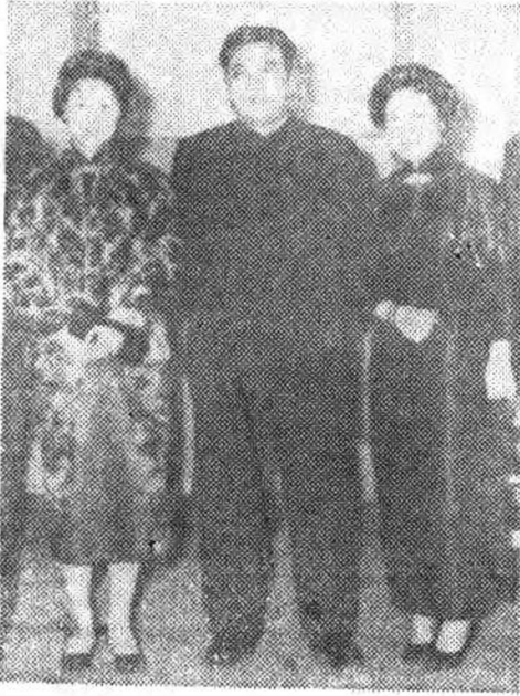
金日成主席和徐玉兰、王文娟在一起