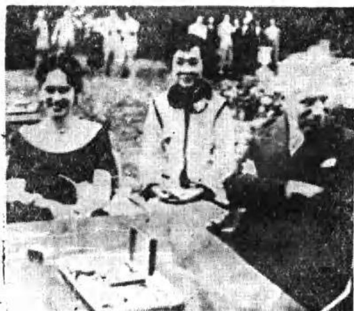
卓别林夫妇与范瑞娟