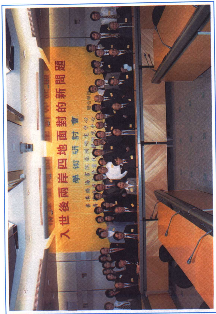
與會專家學者 與工作者合照。