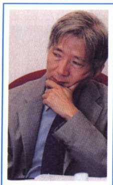
宋恩榮：香港中文大學經濟系講座教授兼系主任。