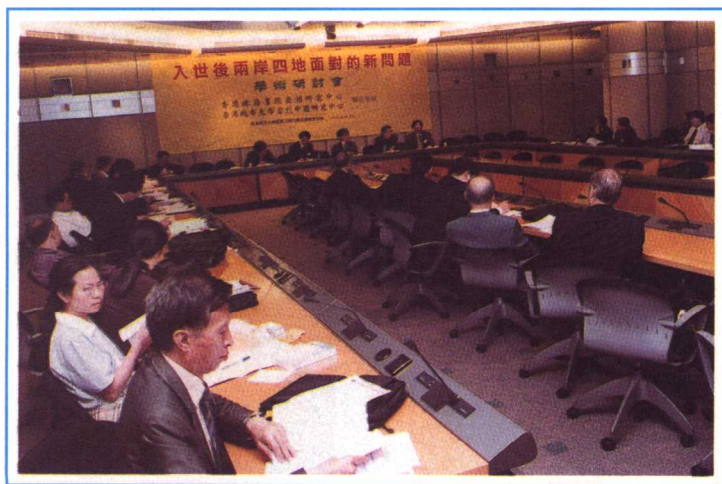
數十人出席了本次會議，圖為大會會場一角。