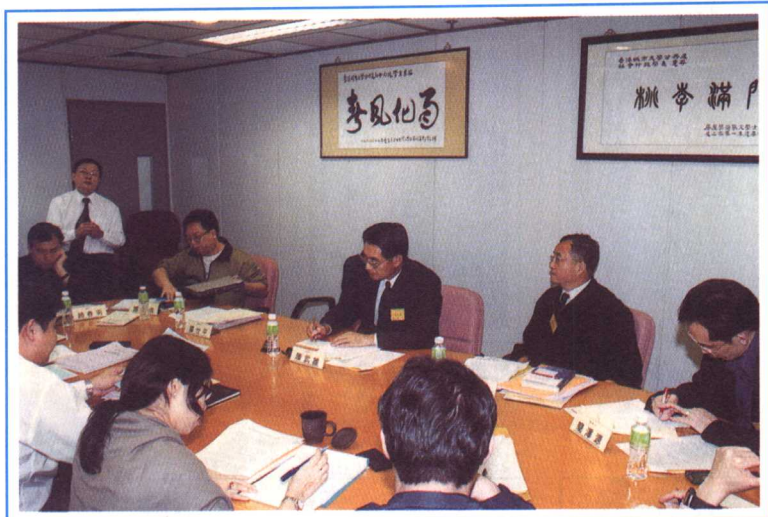
分組討論，發言熱烈。