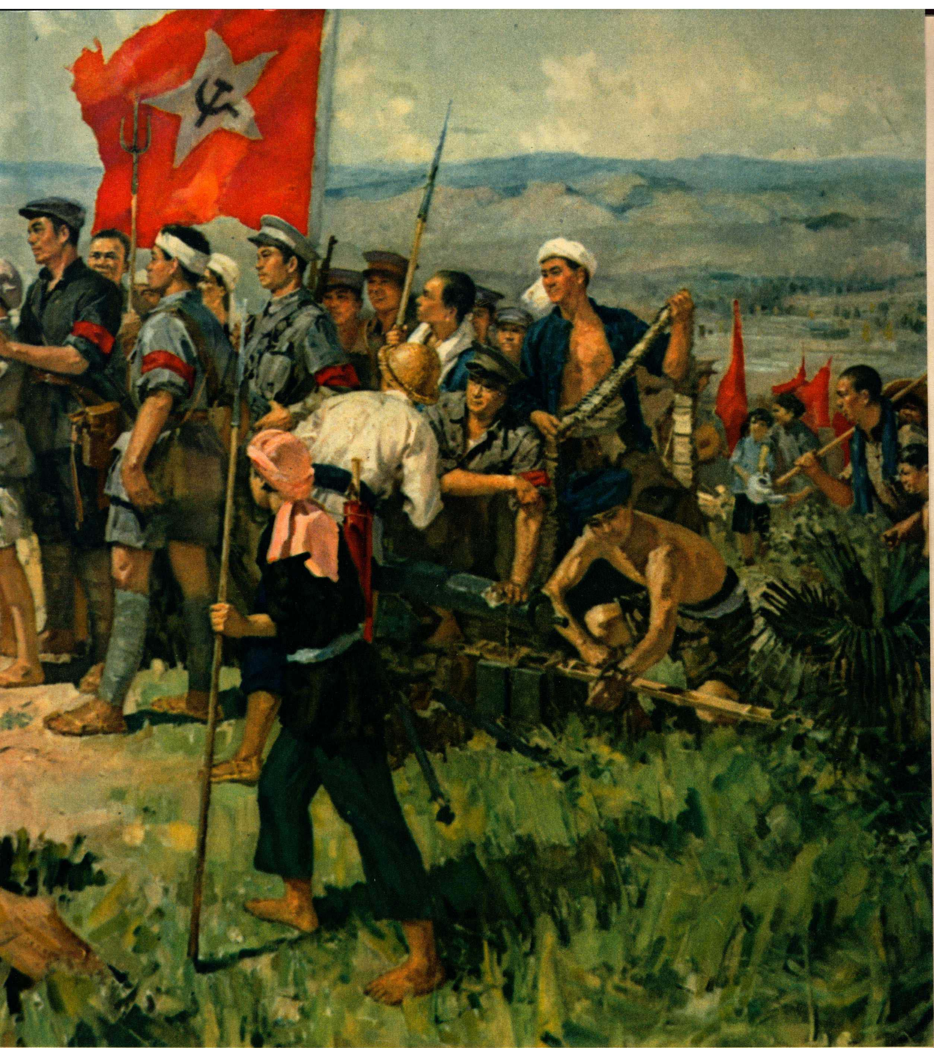
高虹、彭彬、何孔德、韩柯作