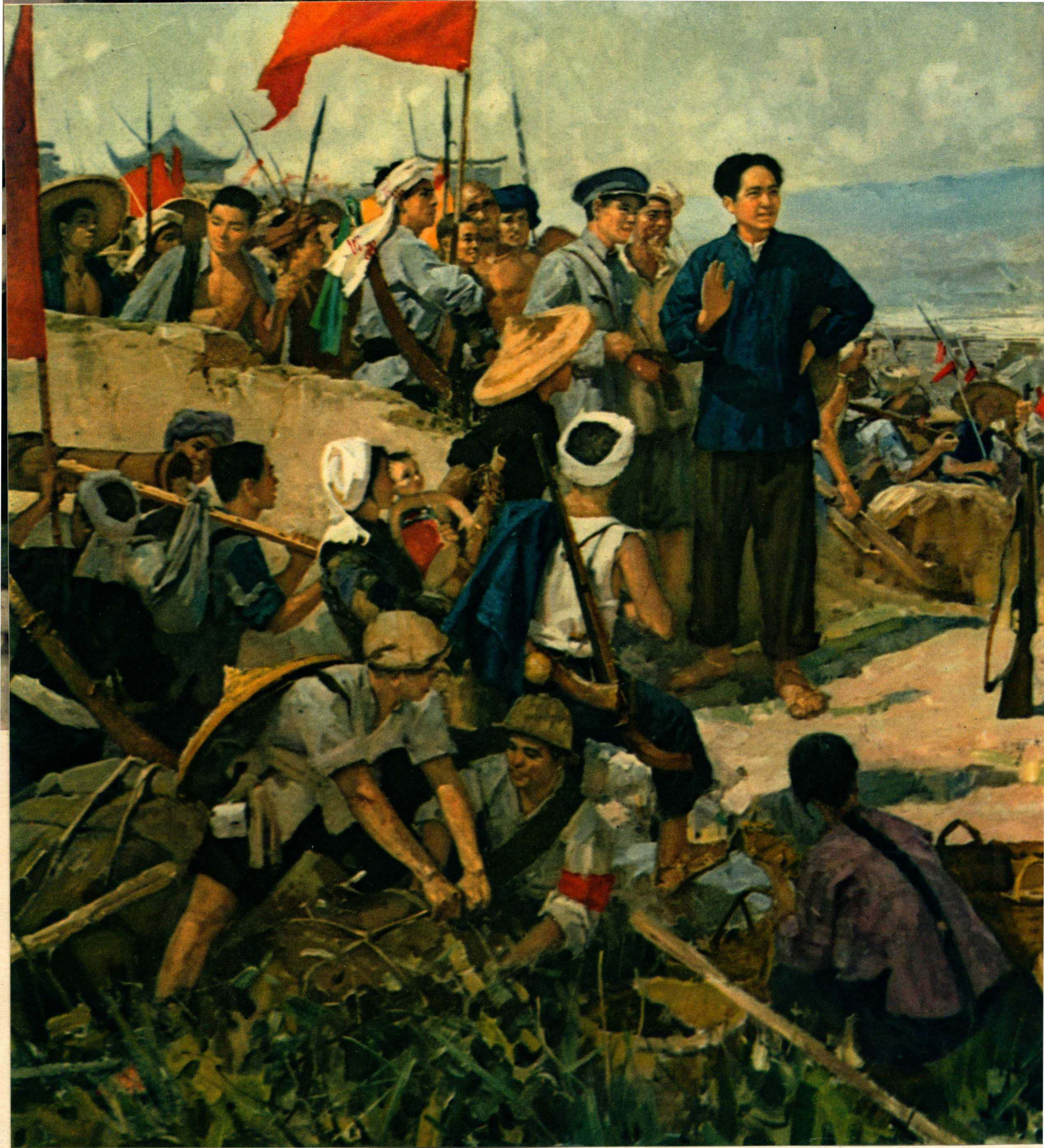
毛主席在文家市 (1927年)