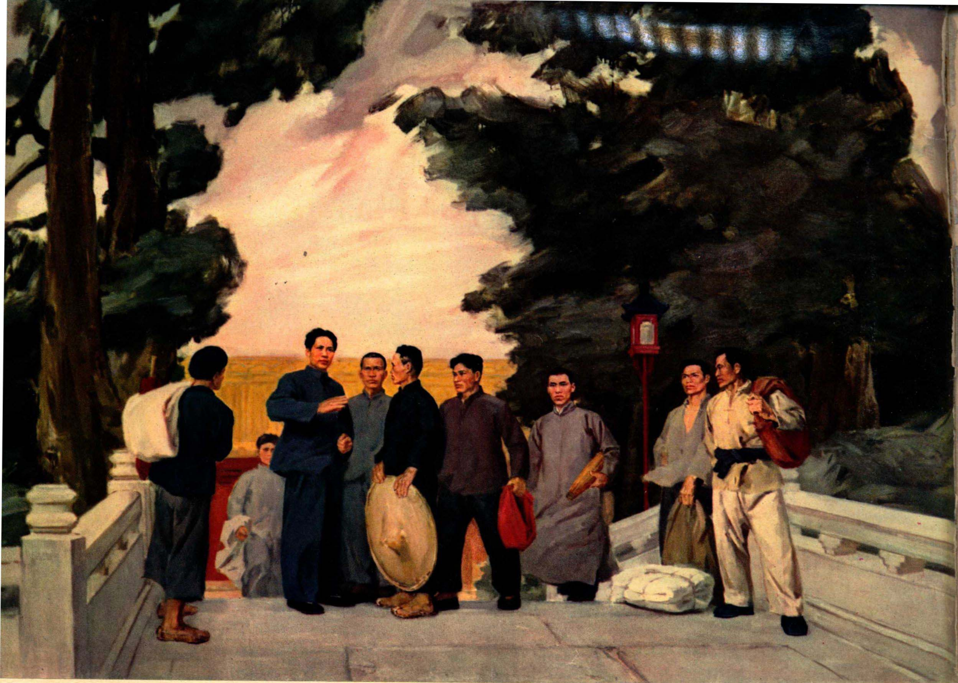
毛主席在广州农民运动讲习所 (1926年)