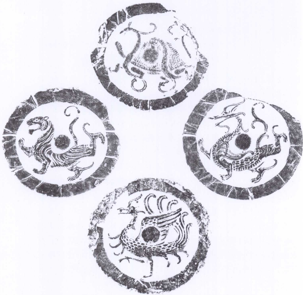
1-2a 四神瓦拓(tà)本——青龙、白虎、朱雀、玄武 西汉 面径18厘米 陕西西安汉长安城遗址出土 古陶文明博物馆打拓

四神瓦流行于西汉。青龙、白虎、朱雀、玄武(蛇蟠龟)分别代表东西南北四个方向。对于四象的意义,从汉代青铜镜的镜铭上可以看到非常详尽的解释。比如汉代博局纹镜(TLV镜)镜铭中就有:“刻治六博中兼方,左龙右虎游四旁。朱雀玄武顺阴阳,八子九孙治中央。常葆父母利兄弟,应随四时合五行。”以及“左龙右虎掌四旁,朱雀玄武顺阴阳。八子九孙治中央,刻具博局去不祥。”六博局几乎涉及了汉代人所有的时空、宇宙、神人观念,系统而完备。(所谓“博局”,指的是汉代一种棋类游戏“六博棋”的棋盘。)可惜六博玩法早已失传,我们也就一直未能完成对它的意义的全面理解。