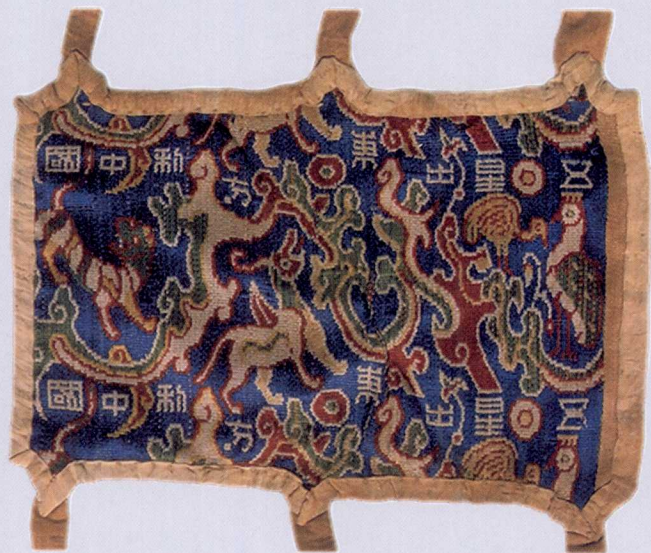
1-1 “五星出东方利中国”彩锦护膊 汉魏 纵 11.2 厘米、横 16.5 厘米 1995 年新疆民丰县尼雅遗址出土