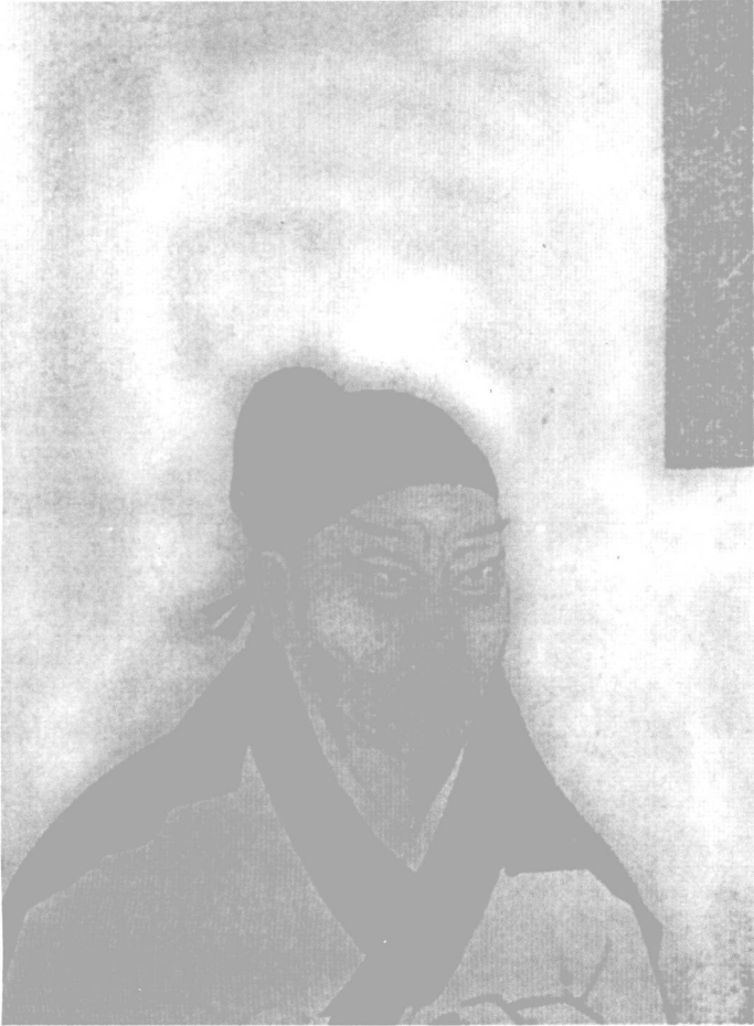
司马光像 (清南薰殿旧藏先贤像)