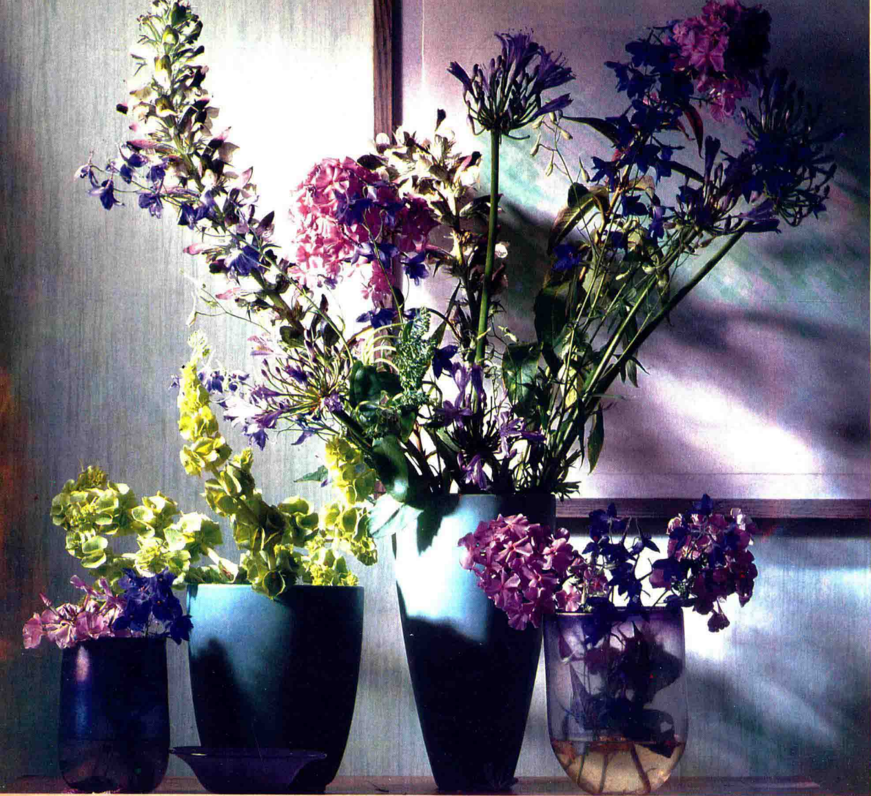
(上图)白子莲、飞燕草等同系色的组合。再插上作为重心的淡绿色植物，花瓶的颜色也与整体组合浑然一体。