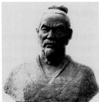
滕州墨子纪念馆墨子讲学石雕像。

孔学“道大，无所不包”。孔子阐扬的仁、礼、德、孝、悌、忠、恕、中庸等政治伦理观念，给中国的政治制度和中国人的民族性格以深刻影响。在这个庞大体系里，自然知识相对贫乏；儒家治学、执教，“游文于六经之中，留意于仁义之际” 〔1〕 ，很少涉及生产技艺和理论性自然知识的研究与传授。孔夫子“轻自然、斥技艺”的文化取向，在中国宗法皇权社会特有的气候土壤条件下，得到滋生蔓延，给两千余年的文化教育，以至整个社会生活，都带来深广影响。