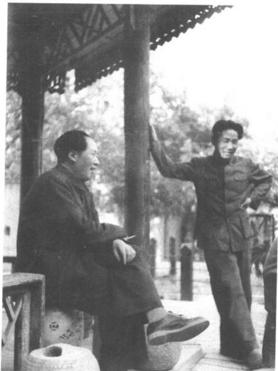
◀ 1949年，父亲毛泽东与我大哥毛岸英在北平香山。