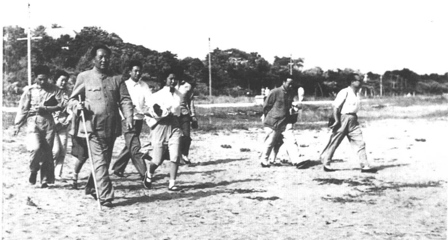
▲ 1954年7月，父亲与我及身边工作人员在北戴河。