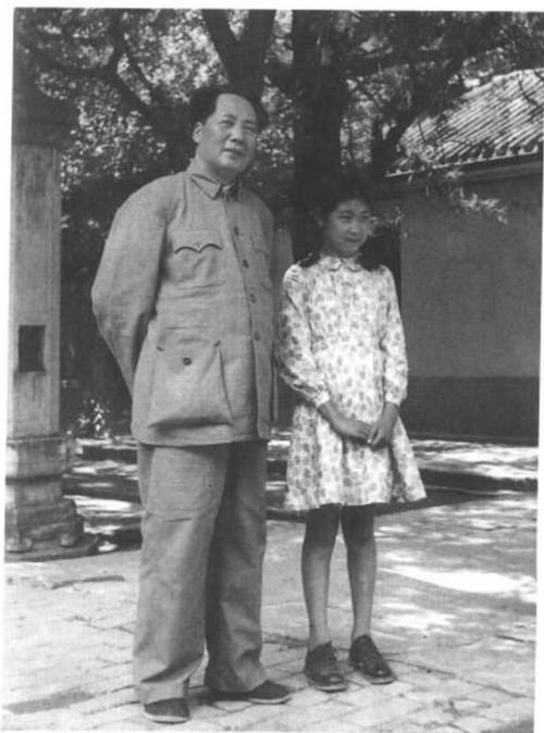
▶ 1949年7月，父亲与我 在香山。