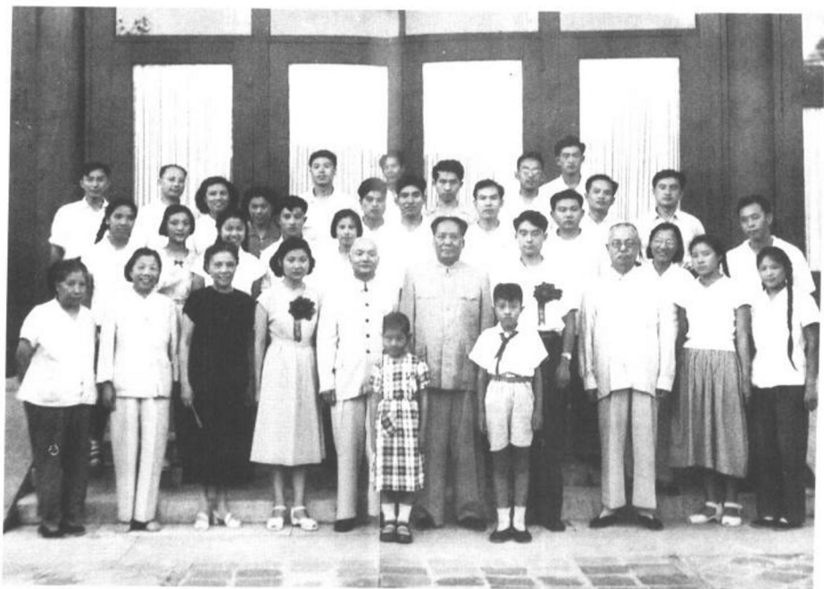
▲ 1959年8月28日，我与孔令华结婚时的合影。

注：父亲毛泽东（右五）、公公孔从洲（左五）、王季范（右三）、蔡畅（左三）、邓颖超（左二）。