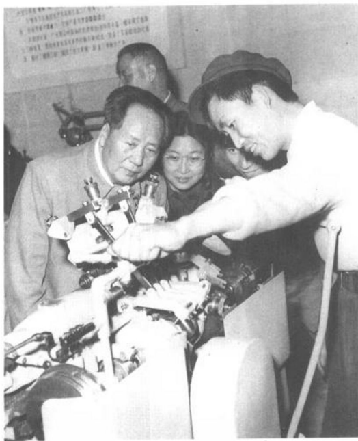
▶ 1960年4月，父亲带我参观工业展览。