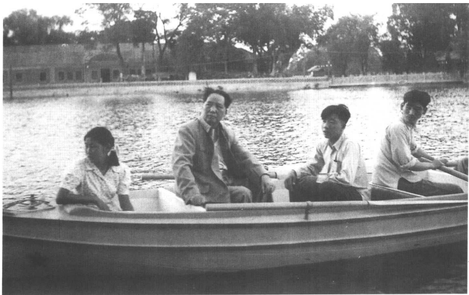
▲ 1951年6月5日，父亲带我在中南海划船。