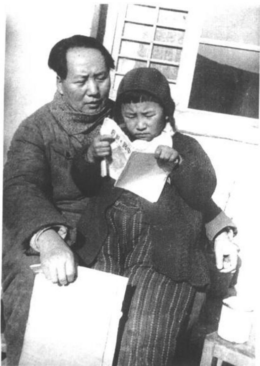
◀ 1946年，父亲毛泽东在延安窑洞前教我的妹妹李讷识字。