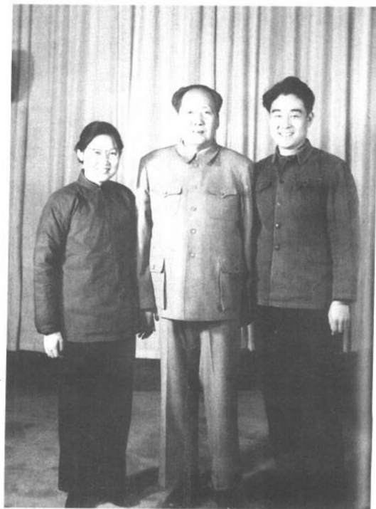
► 1963年12月26日，父亲与我和孔令华在中南海住址。

注：父亲毛泽东（右五）、公公孔从洲（左五）、王季范（右三）、蔡畅（左三）、邓颖超（左二）。