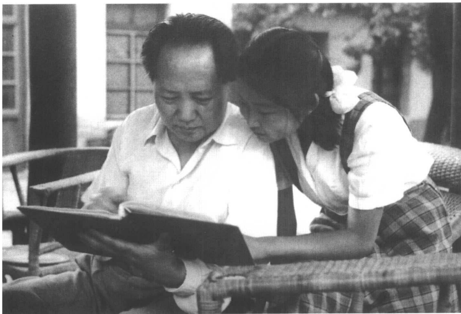
▼ 1951年夏，父亲同我在香山看照片。