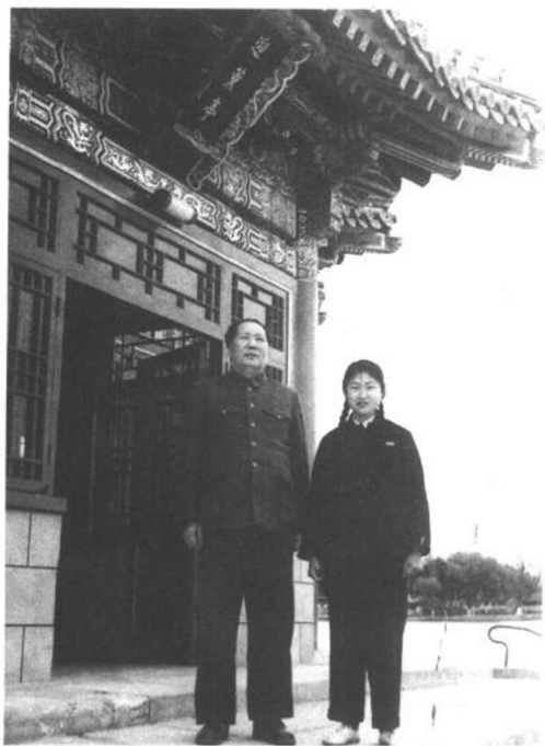
◀ 1953年4月12日，父亲与我在中南海瀛台。