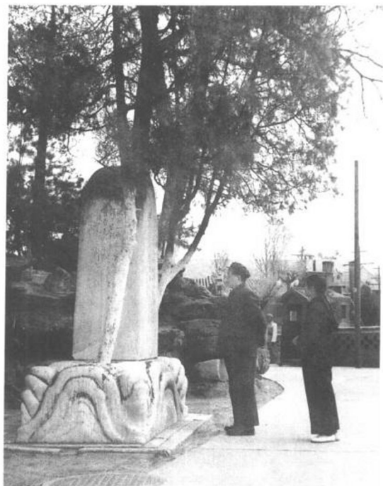
▶ 1953年4月12日，父亲带我到中南海看古碑文。