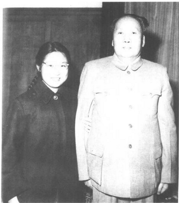
▶ 1961年2月23日，父亲与我在中南海住地合影。