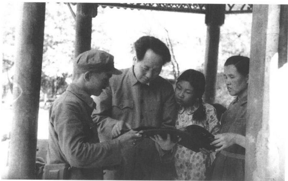
▲ 1949年7月，父亲与我及他身边的工作人员在一起看照片。