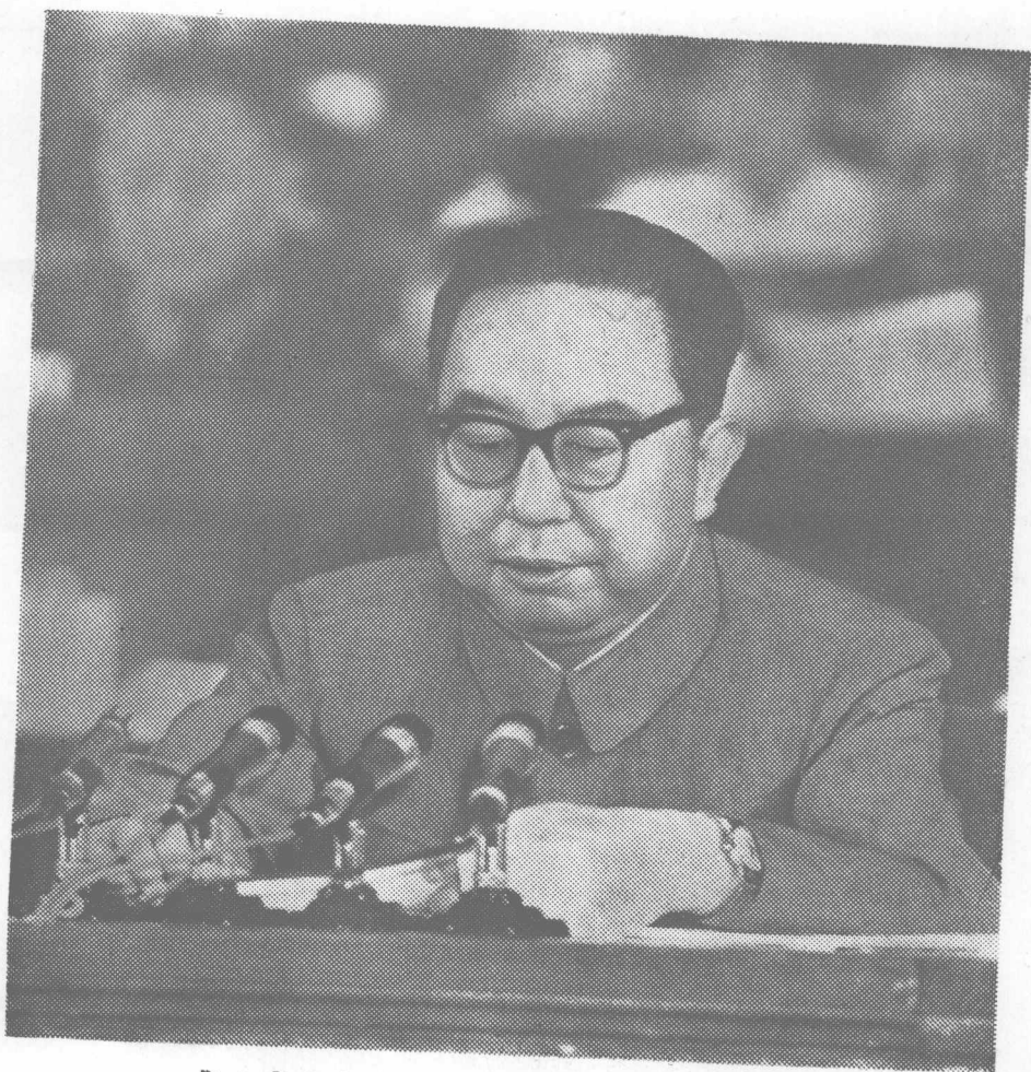
华主席代表中国共产党中央委员会作政治报告。