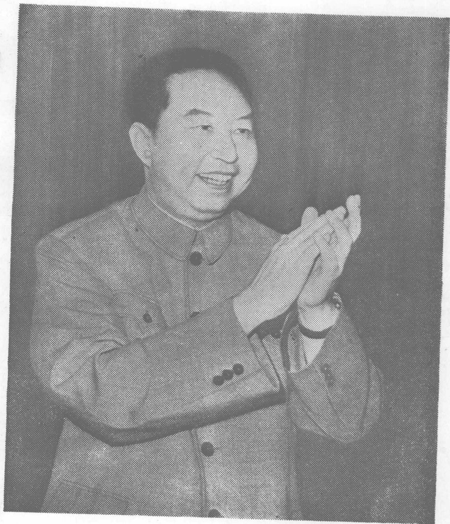
英 明 領 袖 華 主 席