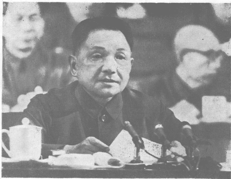
邓小平副主席在中国共产党第十一次全国代表大会上致闭幕词。