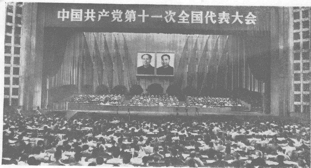
中国共产党第十一次全国代表大会会场。