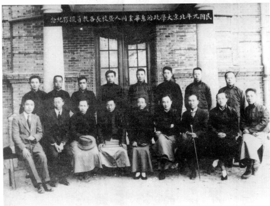
1920年与北京大学政治系毕业同学和教员合影 (前排中坐者为蔡元培)