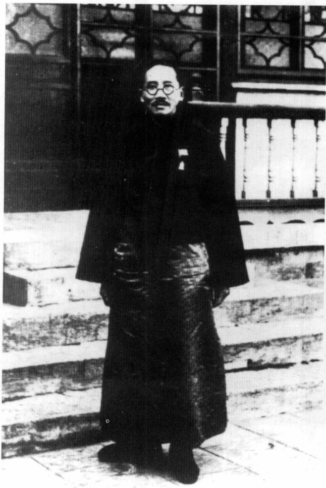
任中央研究院院长时（1931年）