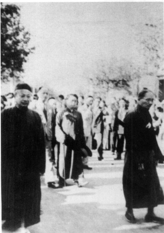
1936年10月23日在 上海主持鲁迅葬礼