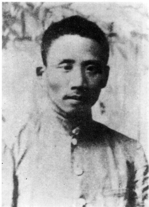
在上海主持中国教育会、爱国学社和爱国女学时（1903年）