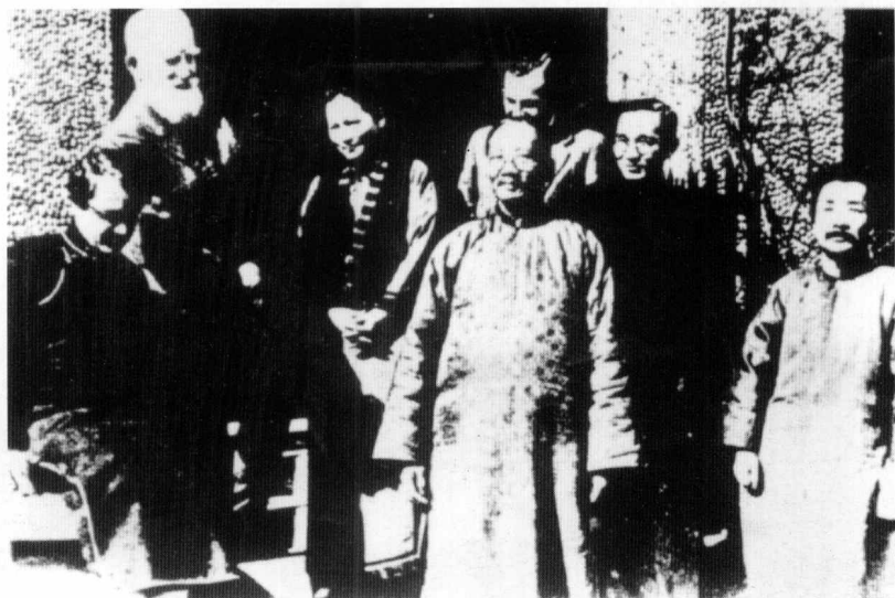
1933年2月17日在上海宋庆龄寓所欢迎肖伯纳合影 (前中立者为蔡元培)