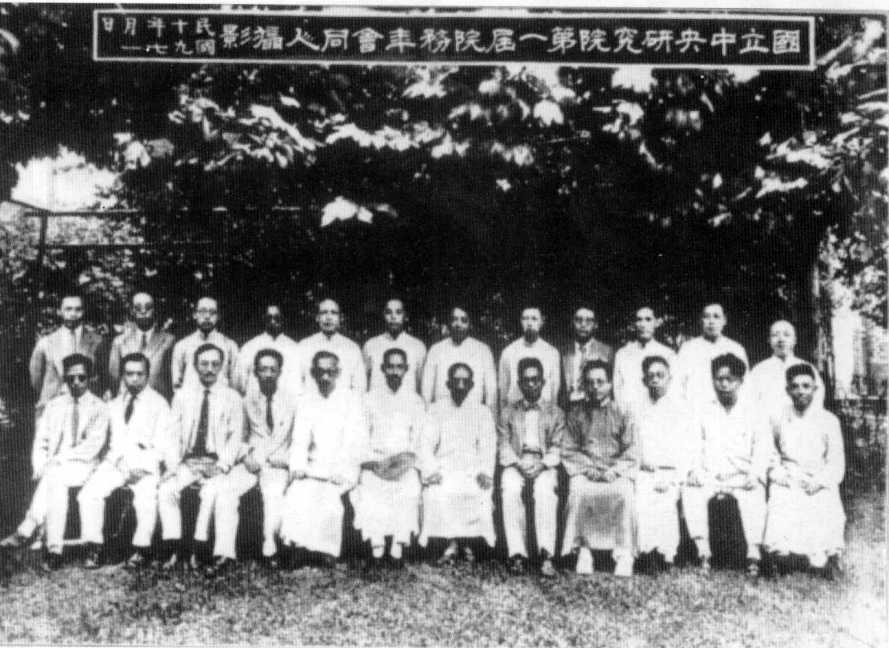
1930年7月1日主持中央研究院第一屆院務年會與同人合影 (前排右六為蔡元培)