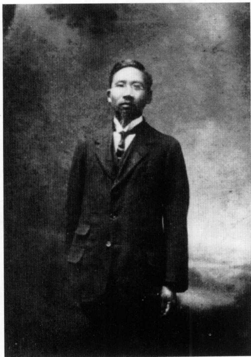
在法国任华法教育会会长时 (1916年)