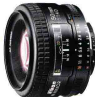
尼康 AF Nikkor 50mm F1.4D