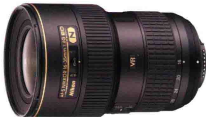
佳能 EF 16-35mm f2.8L II USM