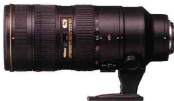
佳能 EF 70-200mm F2.8L IS USM