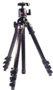
三脚架为弱光拍摄提高了稳定性

在选购三脚架的时候，稳定性是首先考虑的问题。稳定性高的三脚架可以保证相机稳定，进而保证拍摄出来的画面清晰，这种三脚架一般重量较大。