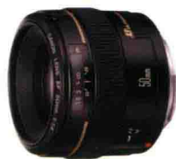
佳能 EF 50mm F1.4 USM

定焦镜头，只有一个固定焦距的镜头，或者说只有一个固定的视野的镜头。定焦镜头的特点：①镜头的口径大，也就是常说的光圈值大，便于在弱光下拍摄，可以很好的虚化背景，突出人物主体；②定焦镜头拍摄人像时画面畸变小，人物更真实细腻；③定焦镜头一般比较小巧，方便携带。对于佳能的用户，EF 85mm F1.2L II USM和EF 50mm F1.4 USM这两款镜头是拍摄人像的首选定焦镜头，同时也是价格不菲。如果你不花太多的钱又想拍到质量很好的图片，建议你可以选择EF 50mm F1.4 USM，拍出来的效果也是很好的。对于尼康的用户，可以选择AF Nikkor 50mm F1.4D和AF Nikkor 85mm F1.4D(IF)这两款，成像也是非常好。