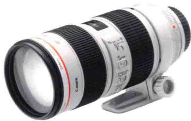
尼康 AF-S 70-200mm F2.8 ED VR