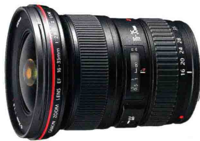
尼康 AF-S 16-35mm F4 VR ED