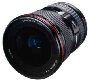
佳能 EF 17-40mm f/4L USM

广角镜头是指镜头的焦距在 17~35mm 之间的镜头。广角镜头的特点：①镜头的视角大，视野非常宽阔，可以把被摄者和其周围的环境一同拍进画面；②景深大，可以表现很广的清晰范围；③可以很好地刻画画面的透视效果。广角镜头畸变大，拍摄人像有一定的难度，建议拍摄时不要以使用广角镜头为主。常用的变焦广角镜头，有佳能 EF 17-40mm f/4L USM 和 EF 16-35mm f2.8L II USM 以及尼康的 AF-S 16-35mm F4 VR ED。