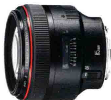
佳能 EF 85mm F1.2L II USM