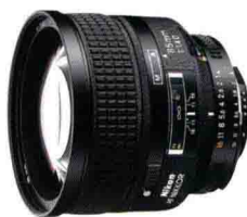
尼康 AF Nikkor 85mm F1.4D(IF)