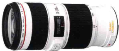
佳能 EF 70-200mm F4L IS USM