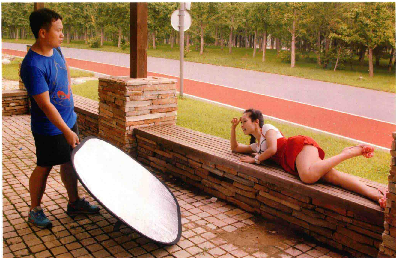
在人像摄影中，反光板是最方便、最常用的补光工具

在人像摄影中，反光板是最为基本的补光工具，也是最为轻便廉价的。拍摄者或者摄影团队的条件好一点的话，还可以使用外接闪光灯、外拍灯等，制造更佳的画面效果。