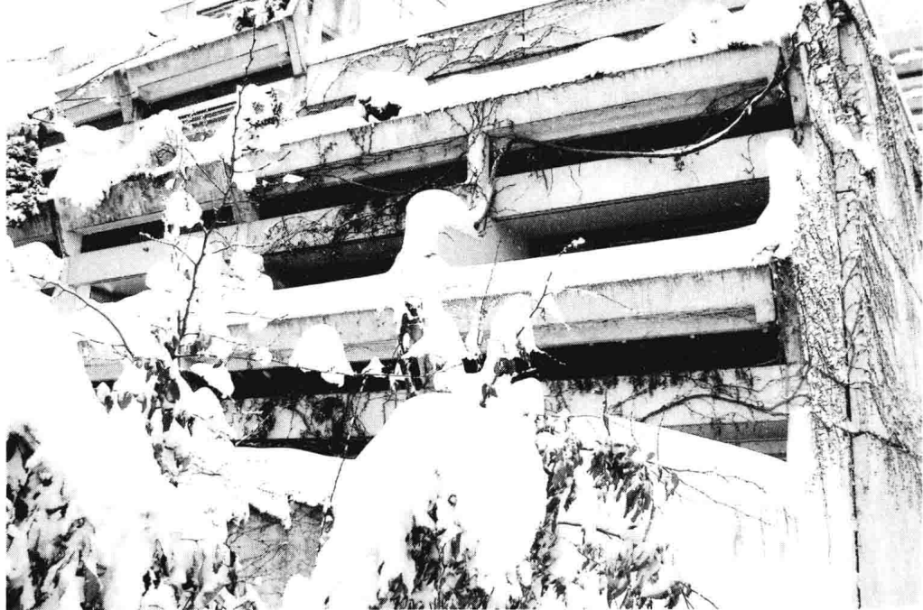
上图：Connollystrasse 31号的后面。人质当时被囚禁在二楼右后方的房间内。

如此，以色列仍然是最需要训练和部署反恐特种部队的国家。1972年5月8日，恐怖分子再一次劫持了一架Sabena航空公司的航班，该航班最终在特拉维夫降落。这一次以色列成功实施了针对恐怖分子劫持飞机的反恐行动，该行动是以色列反恐特种部队解救被劫持人质的典型成功案例。其中使用的诸多技巧现在已经被世界各国的反恐特种部队作为行动标准，比如在相同型号的飞机上进行模拟行动，使用伪装帮助救援队伍接近飞机，以及使用诈术（该次反恐行动中有300多名以色列士兵伪装成被释放的巴勒斯坦士兵，他们乘坐伪装的红十字会救护车接近飞机）等。以色列反恐部队最终成功击毙或抓获了劫持飞机的恐怖分子并解救了全部人质。（这里还有个有趣的事情值得一提，参与本次反恐行动的成员中有两人后来担任了以色列总理，他们是埃胡德·巴拉克和本杰明·内塔尼亚胡。其中内塔尼亚胡在行动中负伤。）以色列以实际行动告诉我们，对恐怖分子的暴行我们没有必要退让和妥协，只要拥有专业的救援队伍和国家、人民的支持，我们在应对恐怖袭击时应该展开积极的行动。