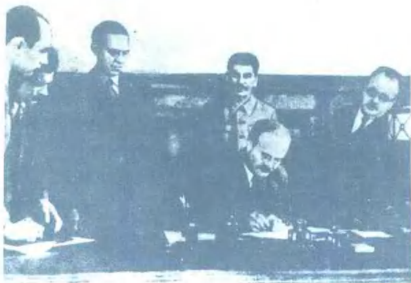
苏英两国政府签署对德联合作战协定（1941年7月12日）