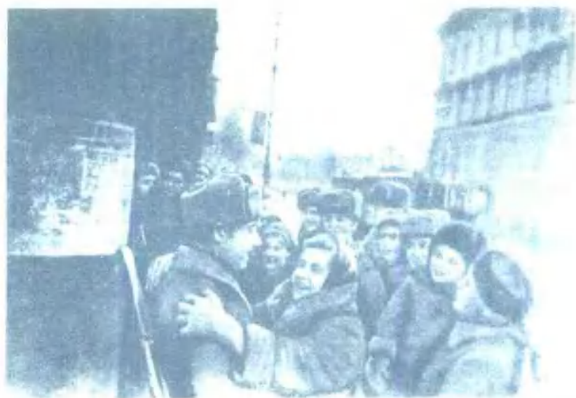
列宁格勒人感谢苏军解除了敌人的封锁（1944年1月27日）