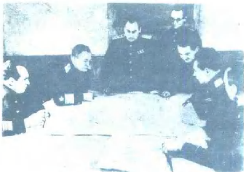
苏联军事代表团在维尔塔（1945年）