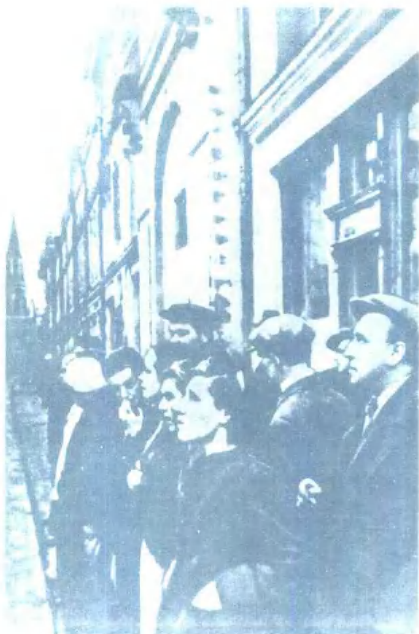
莫斯科人民在傾聽蘇聯政府就法西斯德國背信再發動進攻發表聲明（1941年5月22日）