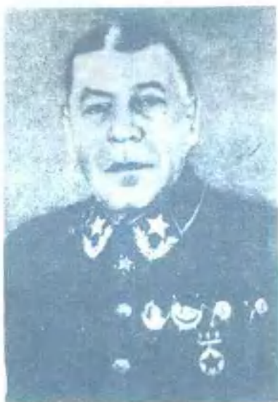
Б. М. 沙波什尼科夫