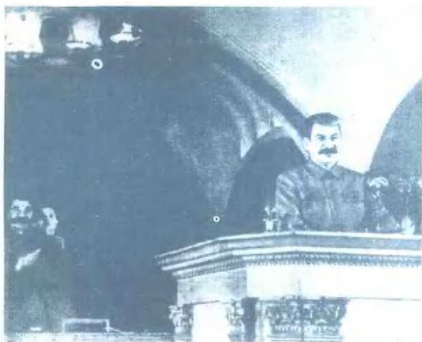
斯大林在伟大十月社会主义革命二十四周年庆祝大会上作报告（1941年11月6日莫斯科）