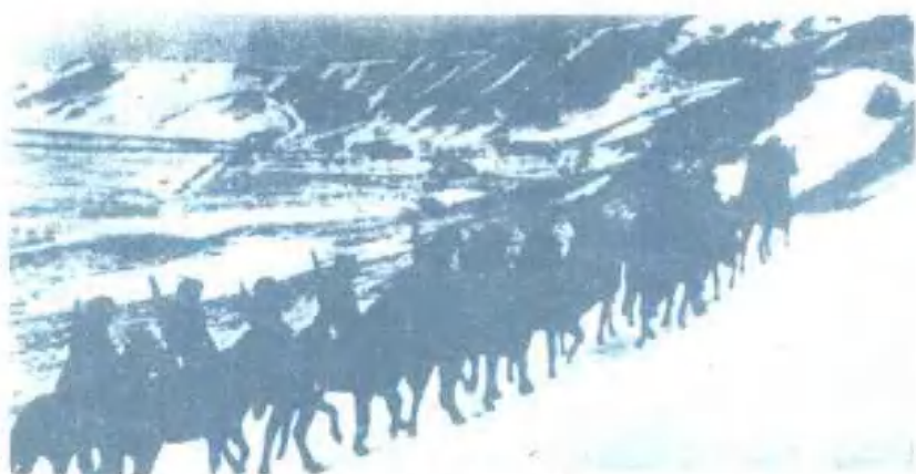
前往执行战斗任务。高加索方面军