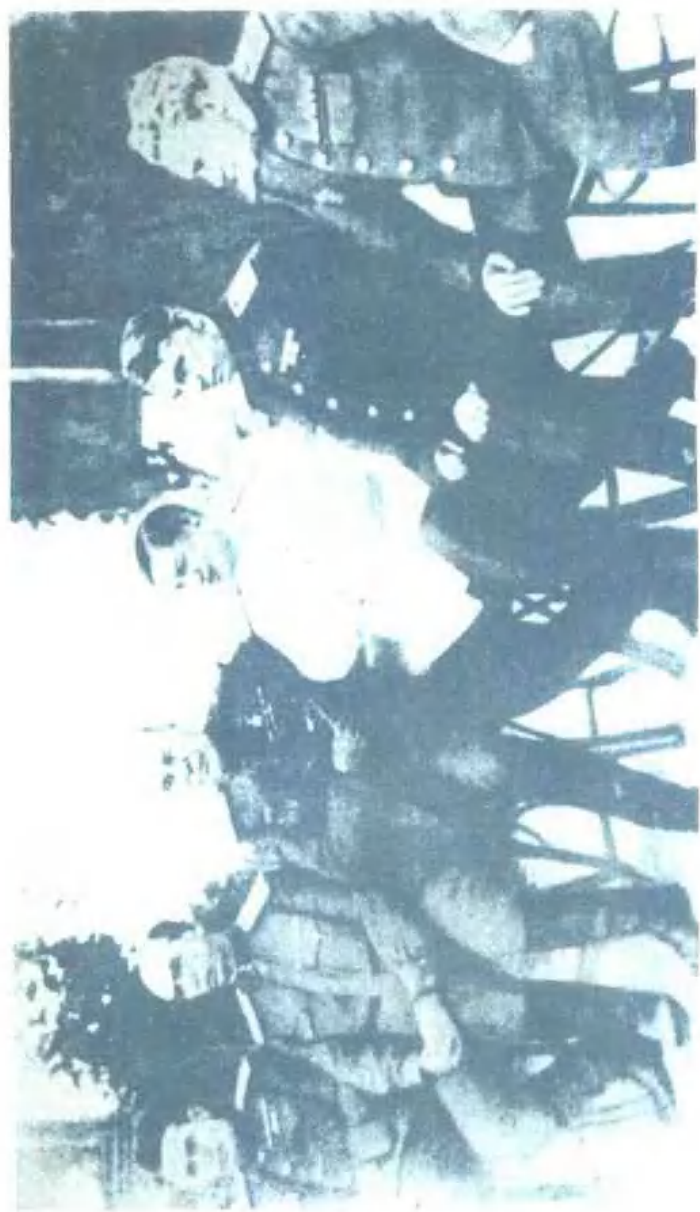
雅西—基什尼奥夫战役前。自左至右：М.Н.沙罗欣、И.Г.什列明、С.К.铁木辛哥、Ф.И.托尔布欣、Н.А.加根、Н.С.别尔札林（1944年8月）