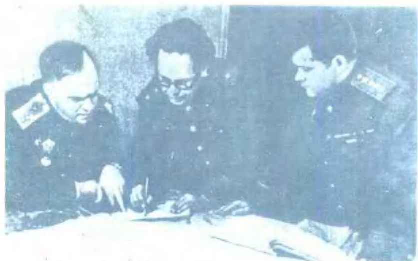
最高统帅部代表Г.К.朱可夫(左)、乌克兰第1方面军参谋长А.Н.博戈柳博夫(中)和方面军司令员Н.Ф.瓦杜丁(右)正在研究战役计划(1943年12月)