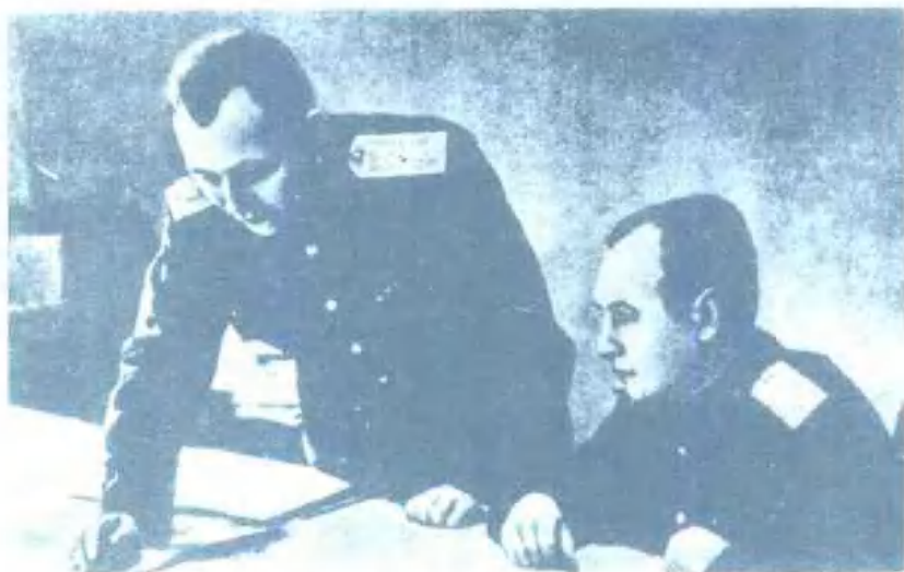
A. H. 安东诺夫（坐者）和 C. M. 什捷缅科