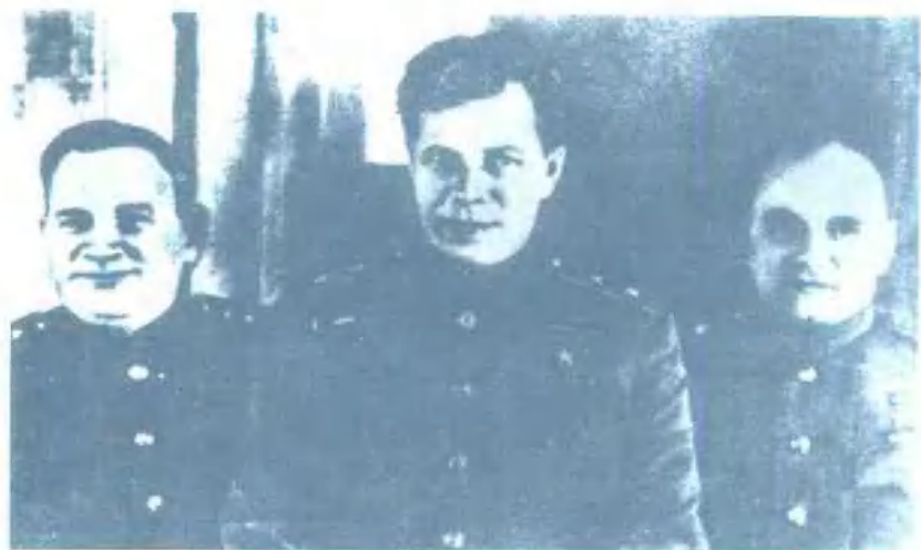
自左至右：红军后勤部长A. B. 赫普廖夫、军械人民委员 И. Ф. 乌斯季诺夫、弹药人民委员B. П. 万尼科夫