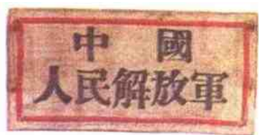
中国人民解放军胸章