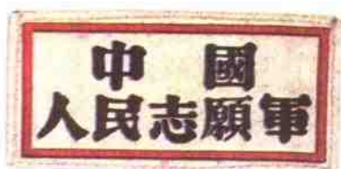
中国人民志愿军胸章