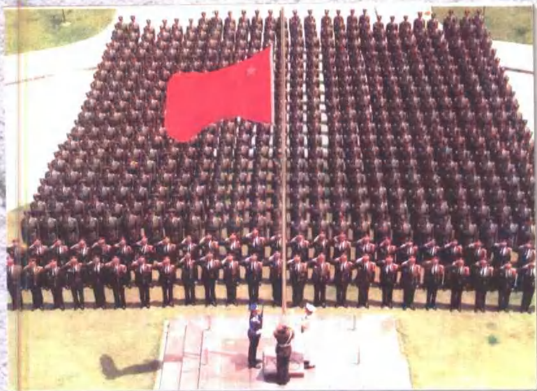
肩负重托,不辱使命。