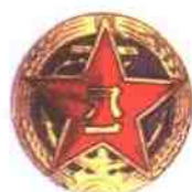
中国人民解放军海军帽徽