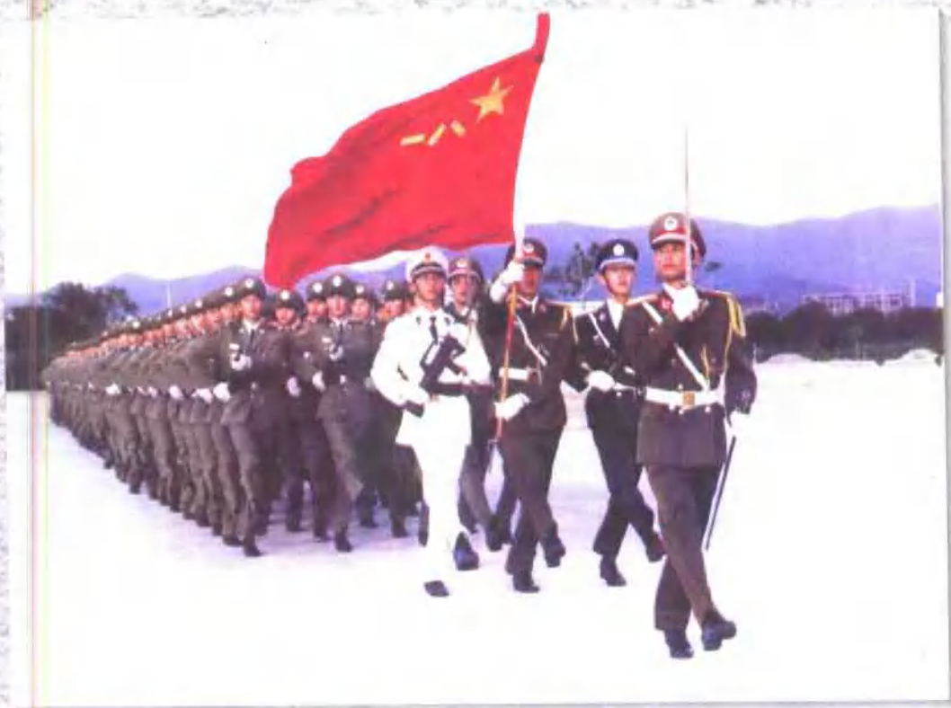
英姿勃发的驻香港部队三军仪仗队