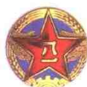
中国人民解放军空军帽徽