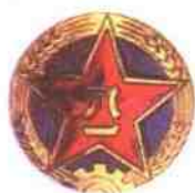
中国人民解放军陆军帽徽