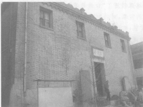
林森家乡的青芝寺

林氏的一支在尚干乡与凤港村一带聚族而居,主要从事农作。林氏家族在福建数百年,族繁丁茂。在林氏宗祠里有这样一副对联:“唐宋元明,八百举人千进士;高祖曾考,十三宰相九封侯。”可见林氏一族获取功名和为官者之多。