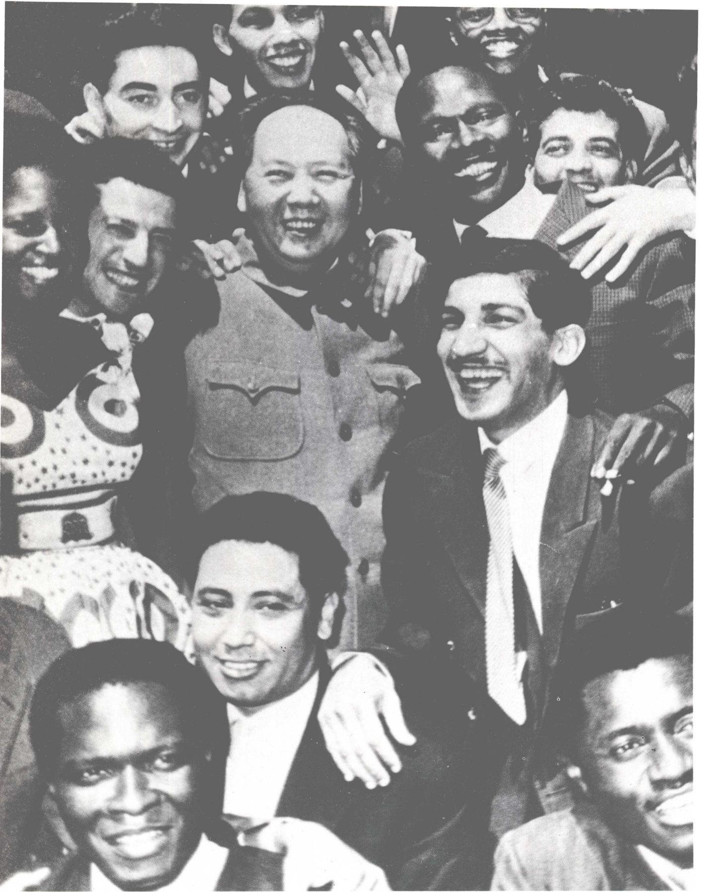
毛泽东和亚非拉各国青年朋友在一起。