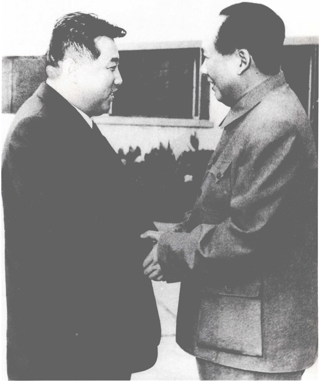
1958年11月，毛泽东主席会见了朝鲜民主主义人民共和国主席金日成。毛泽东主席紧紧地握住了金日成主席的双手，俩人互致问候。