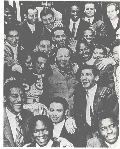
毛泽东和国际友人