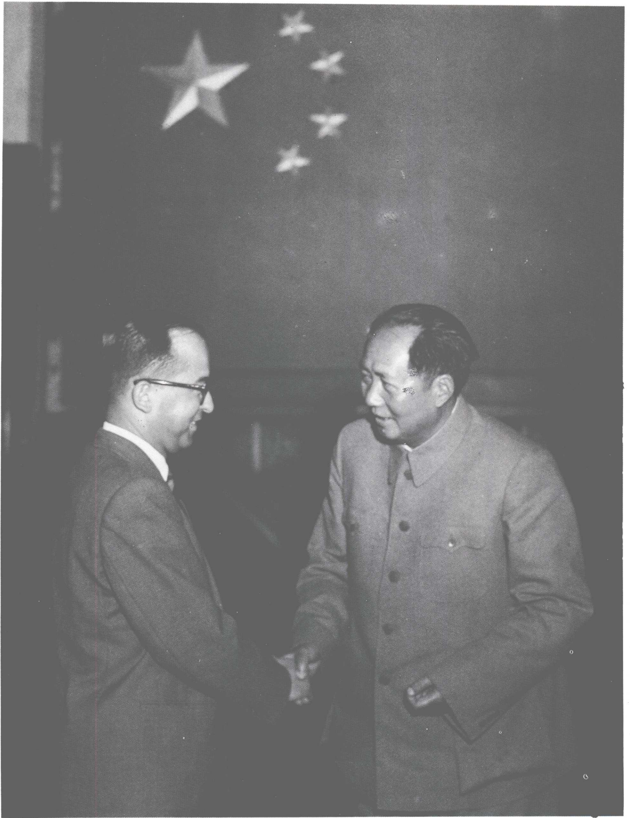
1955年5月29日,毛泽东主席会见阿尔巴尼亚政府代表团团长贝·什图拉。