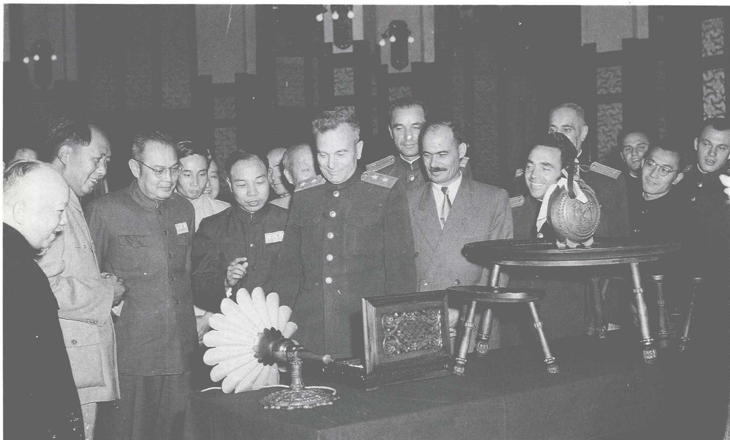
1954年9月20日,毛泽东主席会见了保加利亚人民军迪亚科夫中将等。会见后,毛泽东主席兴致勃勃地观看保加利亚人民军歌舞团赠送的礼品。