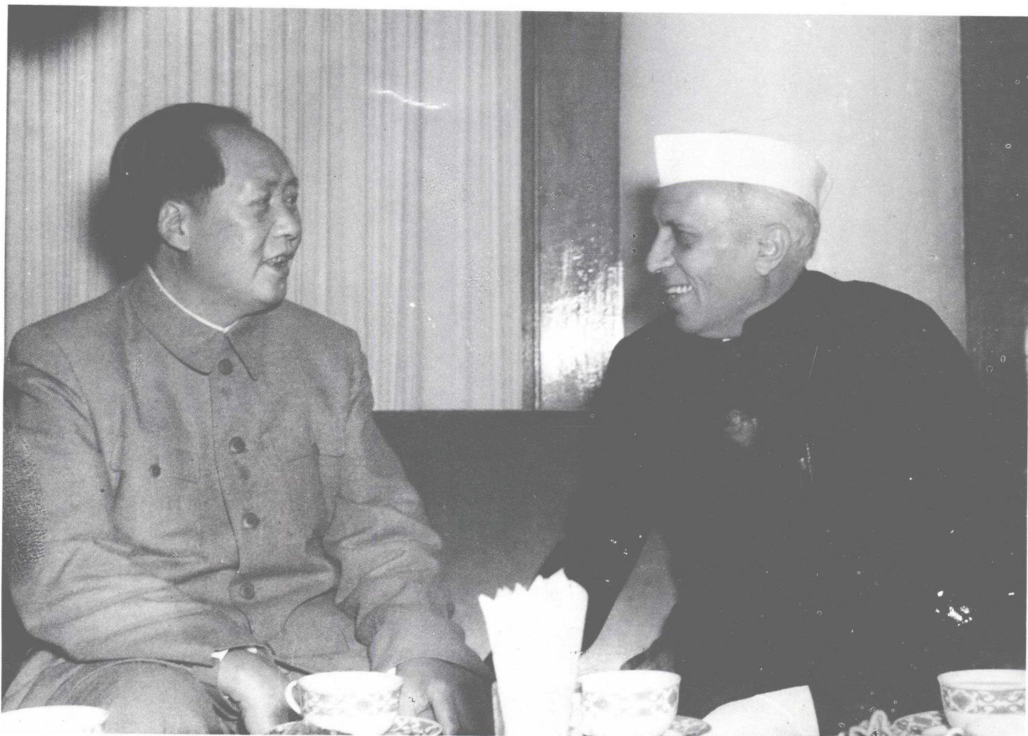
1954年10月21日,毛泽东主席会见印度共和国总理尼赫鲁。尼赫鲁访华期间,印度和中国签署了一项体现和平共处五项原则的协定。从照片上不难看出,毛泽东主席和尼赫鲁总理的谈话是十分融洽的,在许多问题上达成了共识。