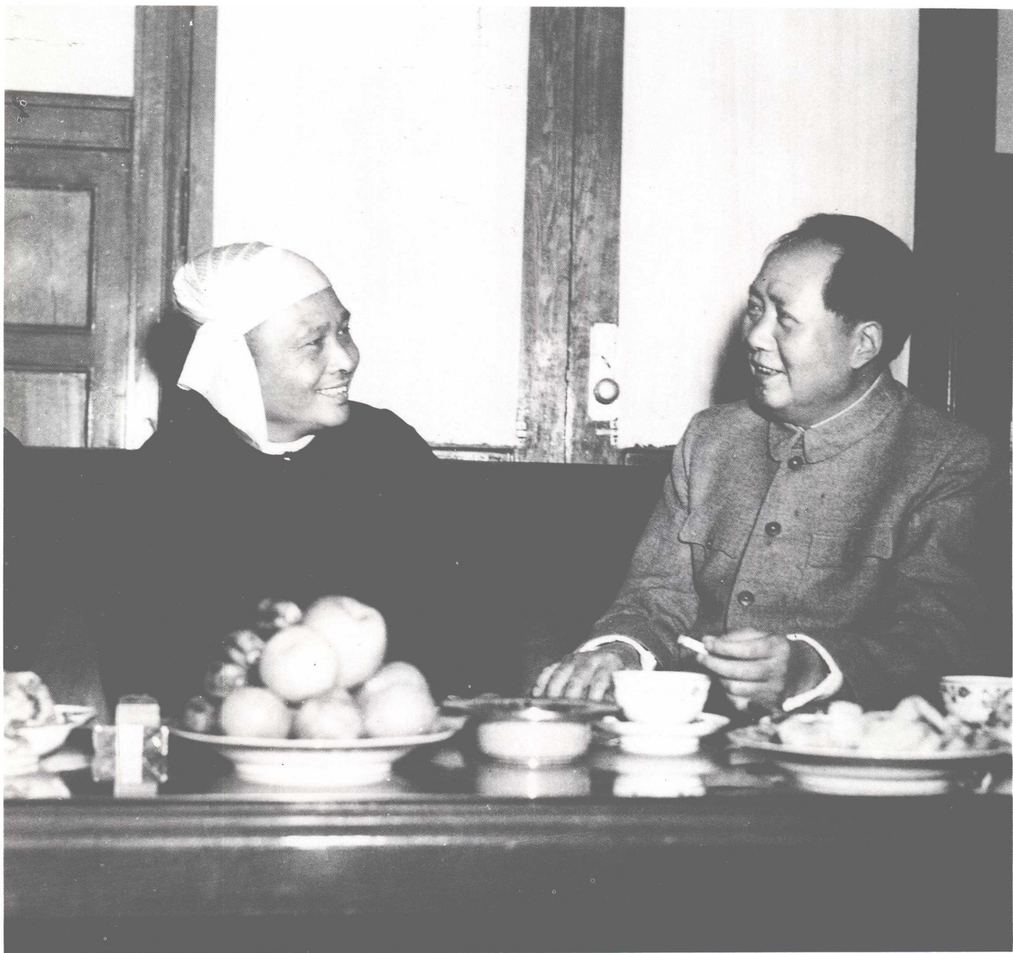
1954年12月4日,缅甸驻中国大使吴拉茂为缅甸联邦总理吴努及其夫人访问中国举行招待会,毛泽东主席和吴努总理在招待会上亲切交谈。