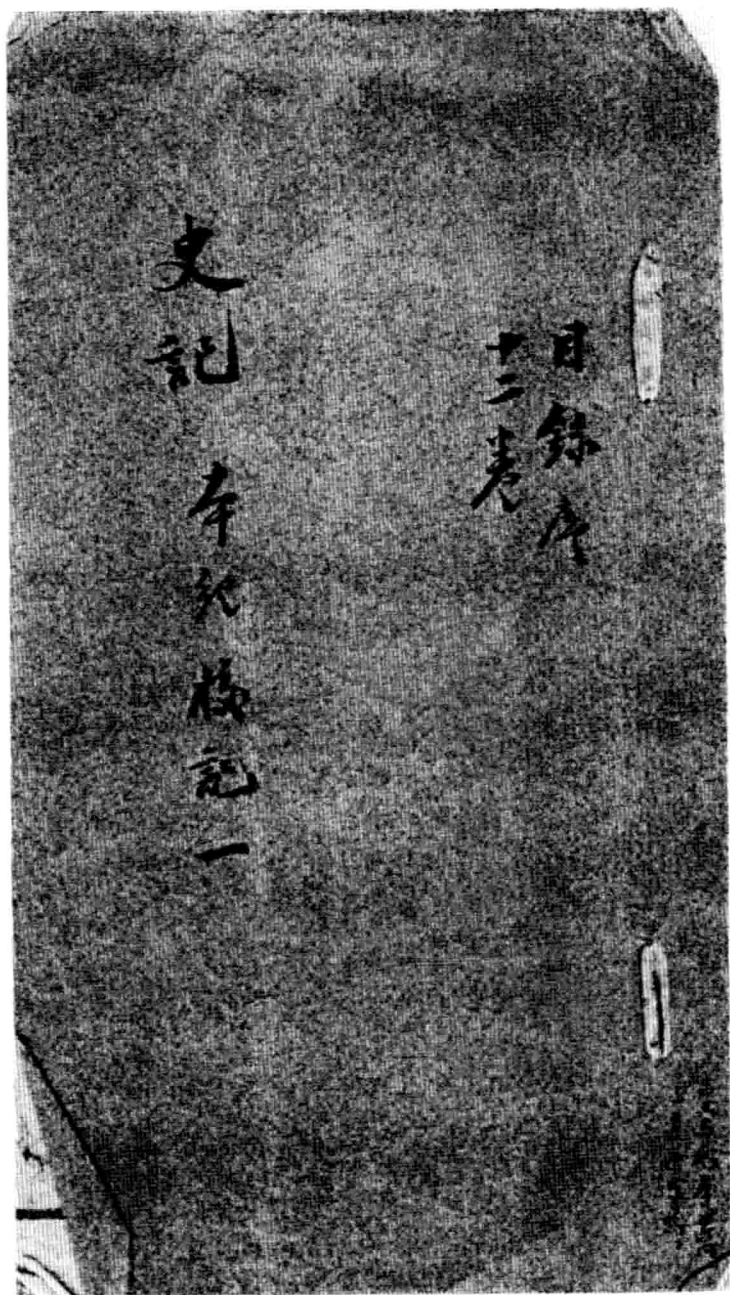
百衲本二十四史《史记》校勘记封面