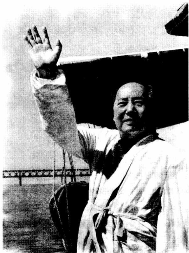
1966年7月16日， 毛泽东主席在武汉再次畅游长江

毛主席一面击浪前进，一面同周围的同志们谈笑风生。一位女青年告诉毛主席：“我这是第二次在长江里游泳了。”毛主席笑着对她说：“长江又宽又深，是游泳的好地方。”陪同毛主席游泳的另一位