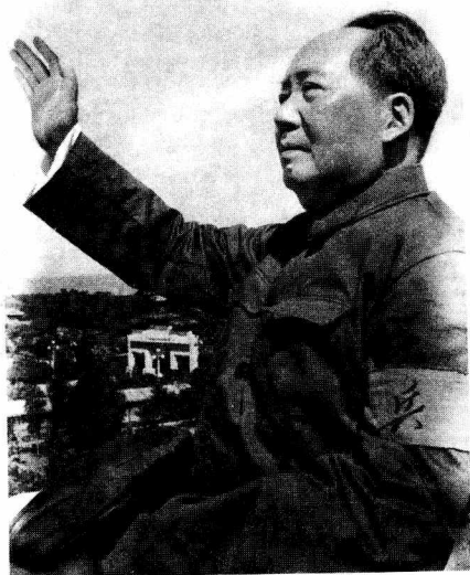
毛泽东发动“无产阶级文化大革命”