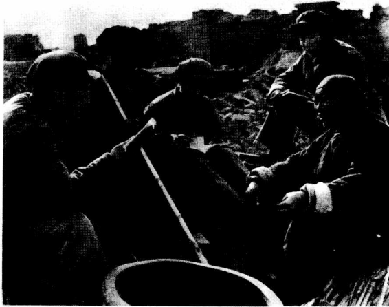
灾区人民与前来救灾的子弟兵一起 学习毛主席著作，增强抗灾信心

左右。在这个地区，有三十个公社、三百五十个生产大队，人、畜、房屋遭受不同程度的损失。