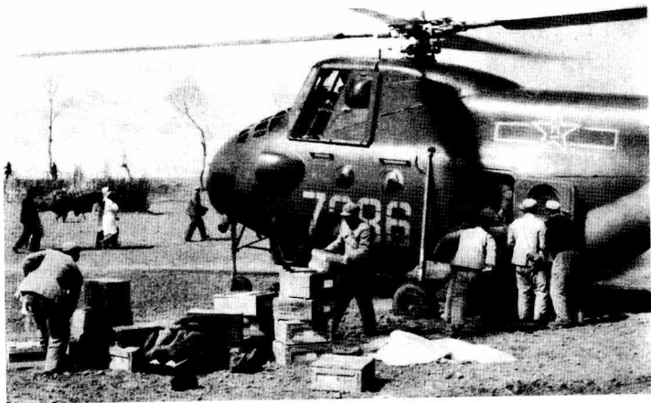
军队直升飞机运送救灾物品到灾区