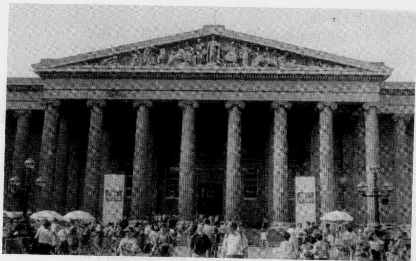
人头攒动的大英博物馆

伦敦——雍容成熟的雾都 当一个人厌倦伦敦时 他也厌倦了生命 因为生命所能给予的一切 伦敦都有