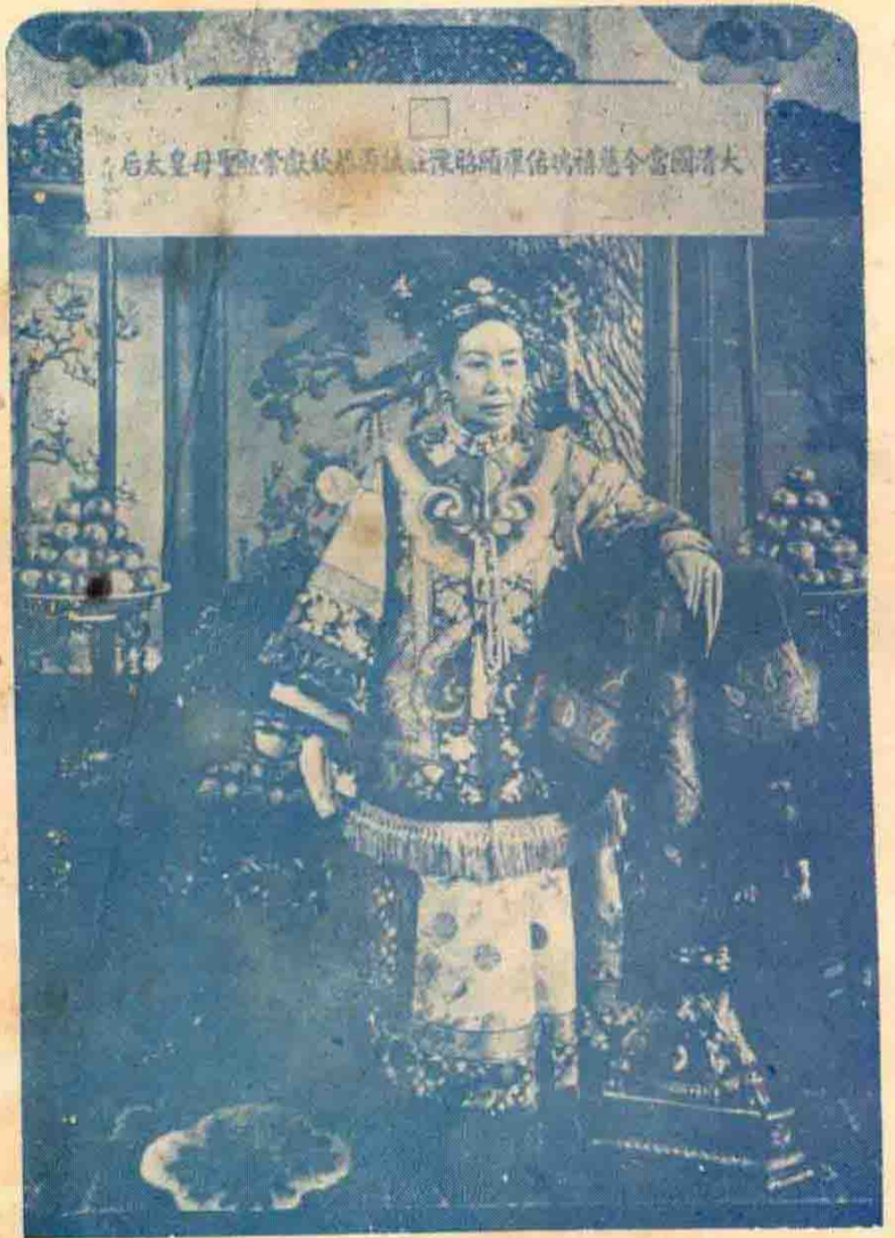
清 慈 禧 后 (巴拿馬賽會之畫像)