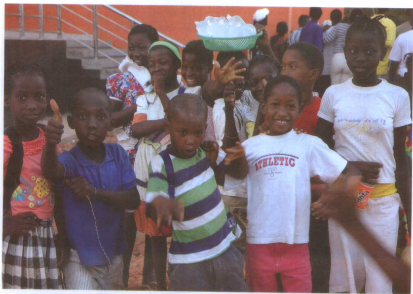
中国援建几内亚比绍工程正式交接