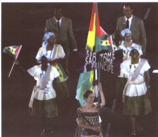
参加第28届夏季奥运会的圣多美和普林西比体育代表团