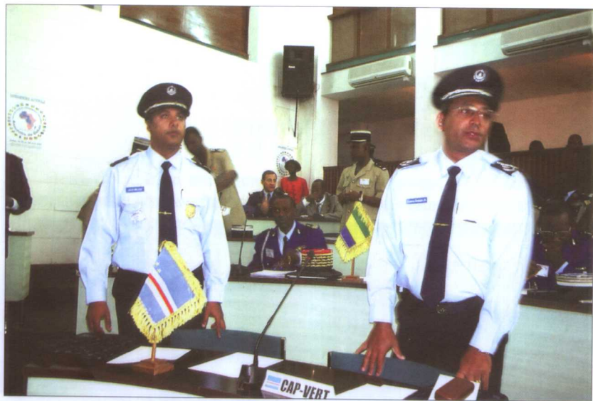
佛得角共和国宪兵部队成立