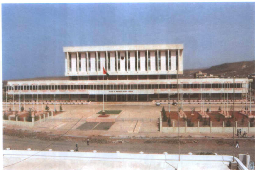
佛得角共和国首都普拉亚