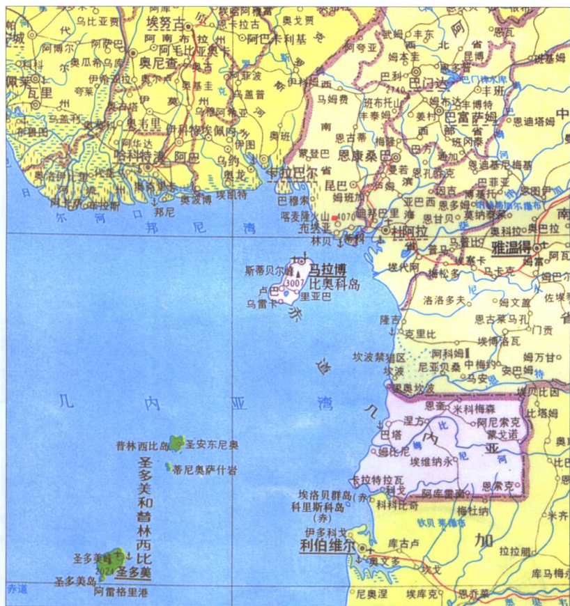
赤道几内亚 圣多美和普林西比行政区划图