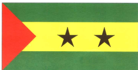
圣多美和普林西比国旗