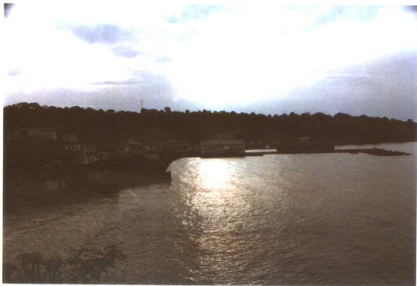
赤道几内亚比奥科岛上的努巴市渔港