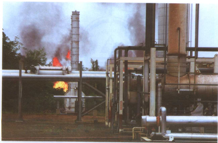
赤道几内亚马拉博郊区的石油和天然气分离设施。