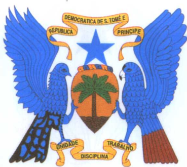
圣多美和普林西比国徽