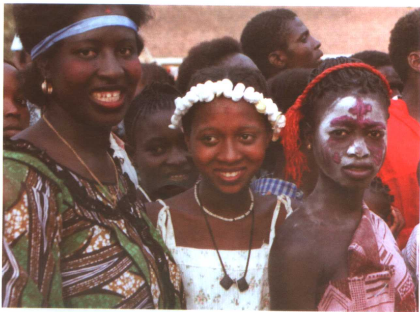
几内亚比绍的女性风采