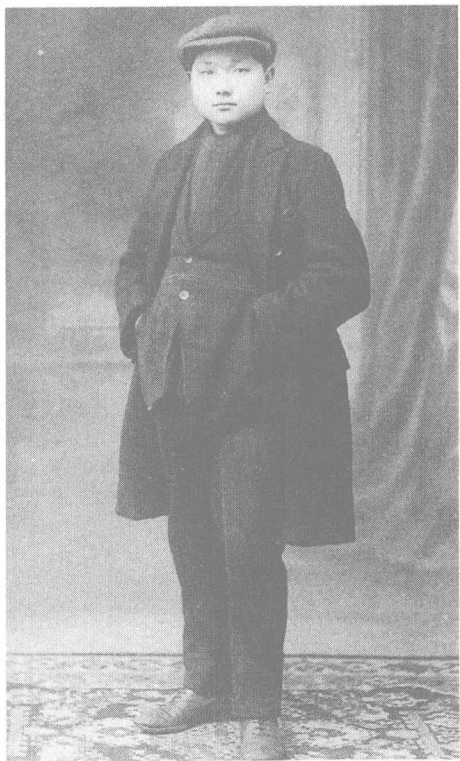
留法勤工俭学时的邓小平。

1931年8月间，我们到了瑞金，这时正值红军主力反对敌人三次“围剿”的时期。瑞金是中央苏区的后方，但当时被反革命分子篡夺了县的党政领导，杀了不少革命干部和革命群众，弄得全县群众不满，干部情绪低落，全县面貌是死气沉沉的。这时在红军工作的谢唯俊同志在瑞金，由上海来的余泽洪