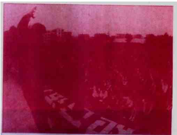
李阳在清华等高校讲学引起轰动