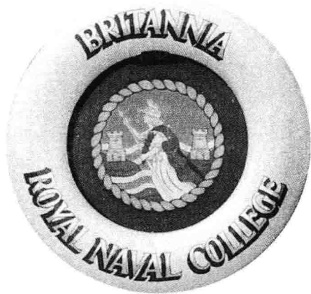
英国皇家海军学院校徽

英国皇家海军学院的全称是“布里塔尼亚皇家海军学院”（BRITANNIA ROYAL NAVAL COLLEGE，简称为BRNC）。在大英帝国的传说中，BRITANNIA是一位勤劳勇敢、不惧邪恶的渔夫，在18世纪末，皇家海军就有了一艘骁勇善战的军舰被命名为“布里塔尼亚”号（HMS BRITANNIA），屡历战功的“布里塔尼亚”号从此成为了大英帝国的骄傲。1863年，经济条件尚为有限的英军就在这艘军舰上成立了布里塔尼亚皇家海军学院。