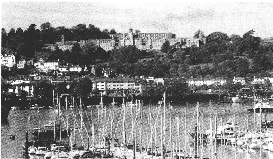
从风景秀丽的达特茅斯小镇远眺气势非凡的皇家海军学院建筑群

1902年，国王爱德华七世亲自出马，为海军学院选定了新校址，1905年9月14日，皇家海军终于在英国西南沿海的一个小城——达特茅斯（Dartmouth）创建了今天规模更加宏伟的皇家海军学院。作为一个骁勇善战的国王，我相信做出这一决定绝不仅仅因为小镇的宁静与秀丽，更重要的是小镇周边的达特河（River Dart）以及风平浪静的宽阔海面。位于达特河与大西洋的交口处的达特茅斯在历史上曾经发生过很多重要的事件，比如1620年9月英国第一艘运载102名清教徒移民驶往北美殖民地的船只五月花“The Mayflower”就是从达特茅斯的港口出发的。1944年，诺曼底登陆发起前，盟军的一部分舰船也是从这里启航。这两个影响世界历史的事件都有达特茅斯的身影，足见其重要的战略地位和历史地位。