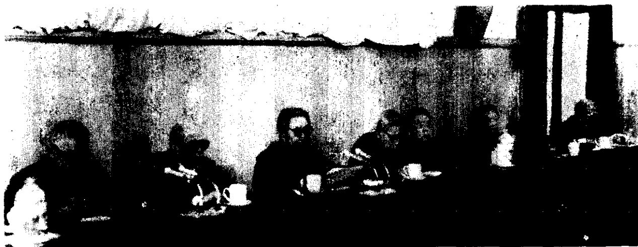
中国史学会第三次代表大会主席团主持会议