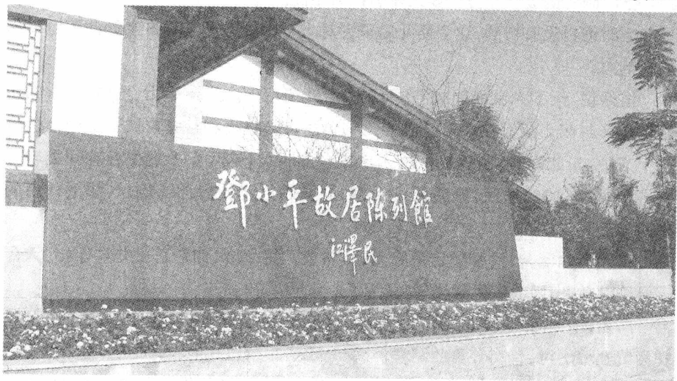
邓小平故居陈列馆

如今，邓小平故居一仍其旧，四周的竹子郁郁葱葱，一块块明镜似的水田、一畦畦嫩黄的油菜花，使人赏心悦目。20世纪50年代初期，邓小平担任西南地区党的最高领导职务，他的继母便搬到重庆和他们同住。邓家的房子就给了村政府。20世纪70年代末期邓小平复出后，四川省政府和广安县政府曾有意在此筹建纪念馆。但邓小平坚决不同意，他说：“照现在样子原封不动，让乡亲们继续住在那里。”故而，邓家的房舍归村里所有，由大约9家住户占去11个房间（邓小平离家后这里可能又增添了一些房子）。当地人将邓小平的旧居拨出老房三间供来访者参观。在正