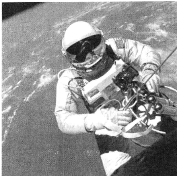
图 1-3 美国宇航员太空行走