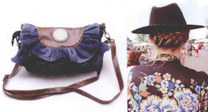
▲ 图 1-4 丰富配饰

韩国的配饰也非常丰富，如腰带和腰链搭配牛仔裤和裙子很抢眼。如图 1-4 所示，一些花布包与牛仔包是最流行的。尤其是牛仔包花样繁多，有的绣上复杂的图案，有的钉上各种彩珠或小石头，有双肩背也有手拎，样式特别多。其他装饰品则更精细，如手链、项链、耳环等，一些细小链子和彩色珠子，水晶或是透明的玻璃做成的首饰最适合与露肩装搭配。在柔软的面料上绣出古典花朵的围巾，有的用灿如宝石的珠子、亮片，细腻地钉出宛若印花般的纹理；有的是以同色系的花纹，再系上各式各样的结，在脖子上轻舞；配上能隐约透出肌肤的长筒袜，把色彩运用到了极致；洁白、淡紫、纯黑、天蓝……跳跃的色彩为身上的服装增添了活力与妩媚。