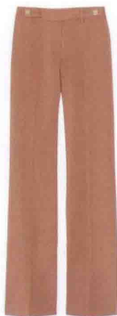
▲ 图 1-2 张扬个性