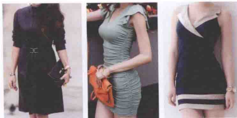
▲图 1-8 尚美塑形

如图 1-8 所示,韩式女装对亚洲女性曲线有深刻的了解和把握,能完美地雕塑女性的玲珑身材,更加适合东方女性的穿衣需求。综上所述,百变的韩式女装在女性时装的大家庭里如此璀璨也就无可厚非了。