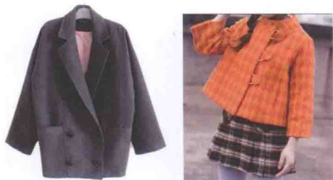
▲ 图 1-5 设计简洁

如图 1-5 所示，韩式女装款式设计简洁、大方，线条感明显。崇尚欧美风，女人味十足，韩味十足的宽松样式，布满了复古的女人味。光彩度一流的质地，大方又亮堂的颜色，让人过目不忘，能突显高雅脱俗的非凡气质。