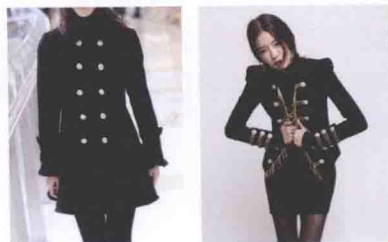
▲图 1-9 混式穿法