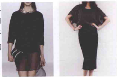
▲图 1-10 娴静气质

韩式女装给人以松软的质感,纯净毫无花巧的装饰,灰白的色调,散发出的就是娴静的气质。如图 1-10 所示,大大的圆领会显出女生漂亮的锁骨位,再加上相同质感的围巾,加强保温性的同时,还能够增强淑女的感觉。肩线比起一般的衣服会比较往下一点,为的是使衣服自然地包裹肩部,体现出流线型轮廓。末端是斜线的造型,衣服在腰身的扎位处使上面形成斜线的皱褶,有别于传统的形式构造。