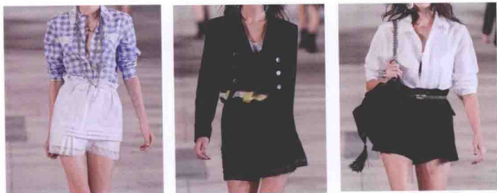
▲图 1-6 款式百搭

韩式女装融合东西方服装文化特点,表现了贯穿于东方国度街头巷尾的服装气味,同时具有浓重的欧美时尚元素,十分契合亚洲人的穿衣品位。展现的是青春朝气、兴旺向上的青春魅力,重视服装细节的设计理念,构成富有国际化、品位化、特性化的时兴作风的服装。款式百搭为主,容易搭配各种款式,制造不同效果,如图 1-6 所示。