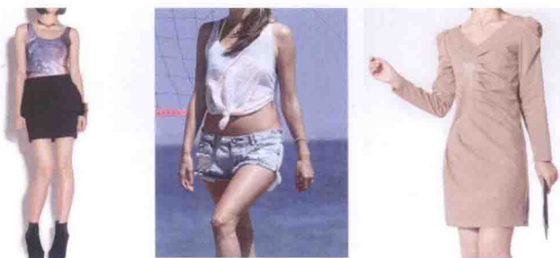
▲ 图 1-3 款式时尚

韩式女装款式具有多元化的时尚感。韩式女装能够在短时间内让消费者热捧，当然有它的引人之处。一些增加韩国服装魅力指数的设计元素也让韩国服装绽放异彩。韩国服装的多元化是个新鲜的元素。最近几年来，韩国服装向多元化成长，将传统的民族风格与世界时尚潮流灵巧高明地联合起来，或端庄或前卫，或内敛或夸张，多种风格各有精彩。炎炎夏日里，漂亮的背心是不可或缺的时尚标签。如图 1-3 所示，丰富的色彩、紧身、适当的透露，营造性感氛围，是韩式背心的追求。