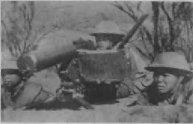
1938年春日寇向鲁南进攻，中日两军在山东台儿庄地区会战，中国军队获得巨大胜利。图为台儿庄外围中国军队的重机枪阵地