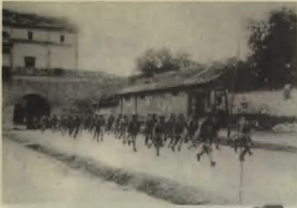
1937年7月7日，日本帝国主义发动芦沟桥事变，我宛平守军赶赴芦沟桥抵御日寇