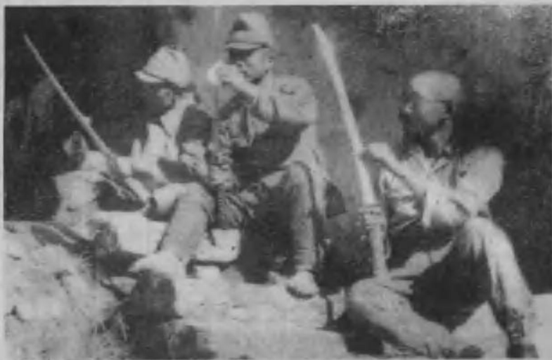
日寇三个杀人“竞赛者”正在抹去刀上的血迹