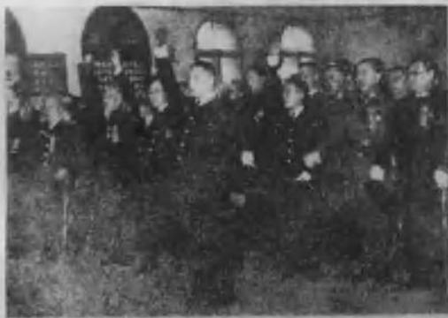
汉奸汪精卫就任伪国府主席