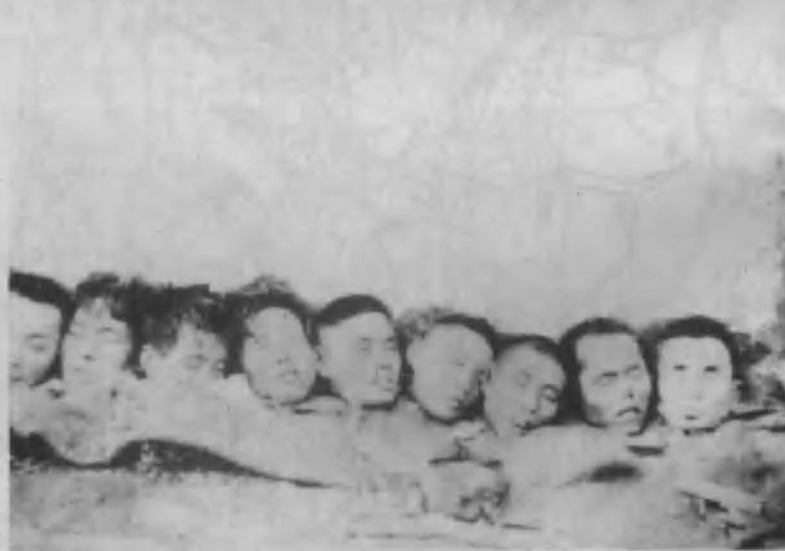
南京大屠杀时被日寇残杀的一排人头