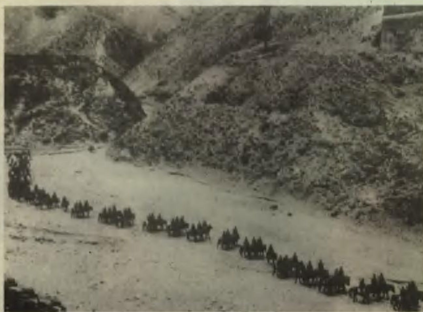
八路军进军华北前线