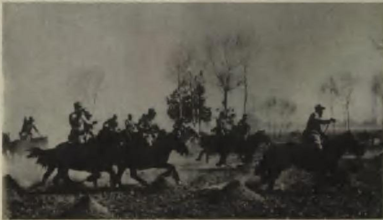
八路军骑兵驰骋于华北战场