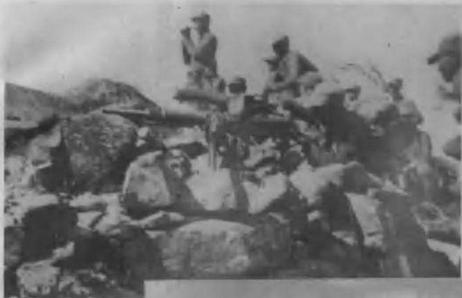
华北敌后地区陈庄战斗中八路军军的机枪阵地