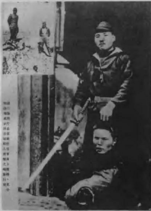
新四军在卫岗战斗中缴获的日寇，就是这样以杀人为乐