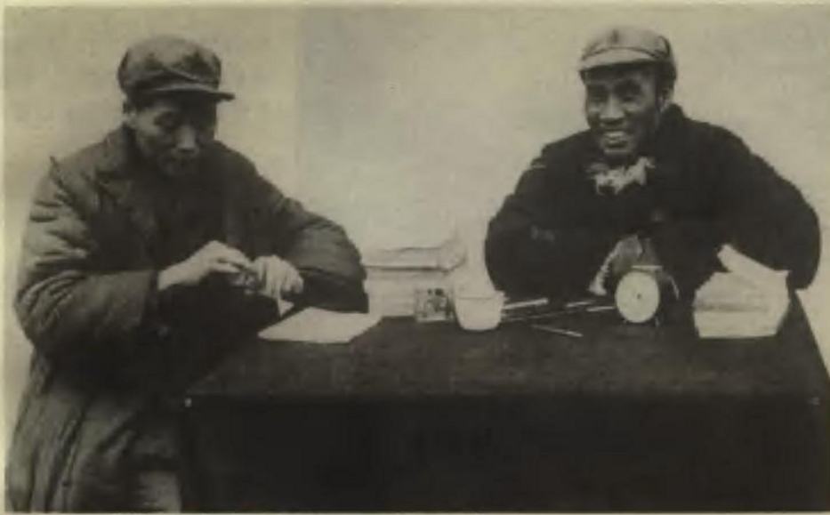
1937年，毛泽东和朱德在延安共商抗日救国大计