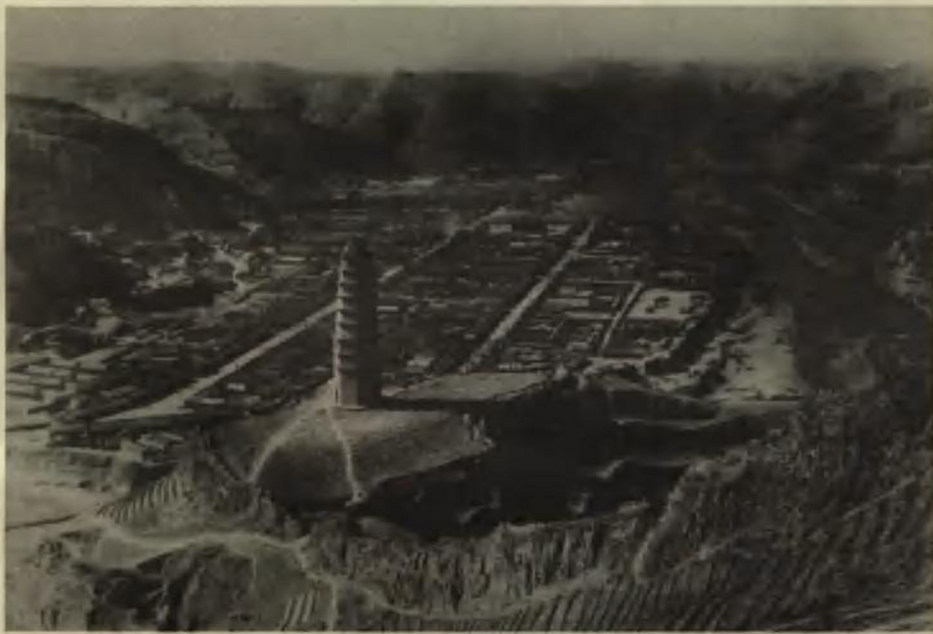
中国抗日战争的指导中心——延安