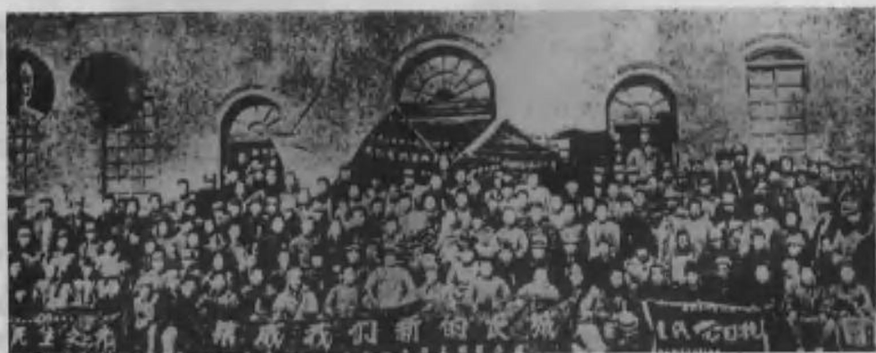
我华北第一个敌后抗日根据地——晋察冀边区举行军政民代表大会