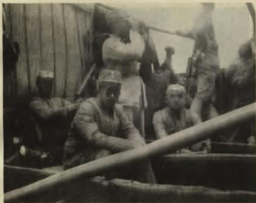
1937年9月，八路军领导干部东渡黄河奔赴抗日前线。图为朱德（后立者）、任弼时（中）、左权（左）和邓小平（右）等在渡船上