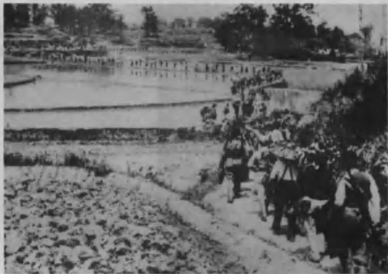
新四军挺进苏南抗日前线（1938年5月）