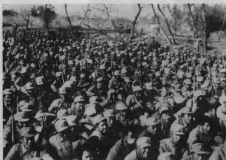
新四军第一、二支队在茅山阵地上