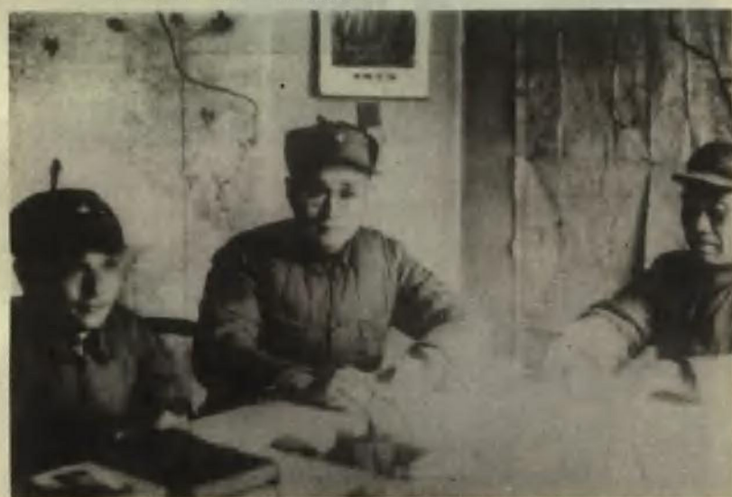
朱德总司令、刘伯承师长、邓小平政委在太行山地区八路军总部制订作战计划