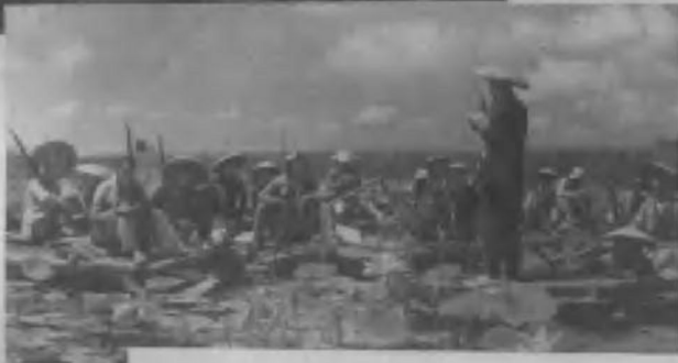
活跃在华北敌后的水上抗日游击队——雁翎队