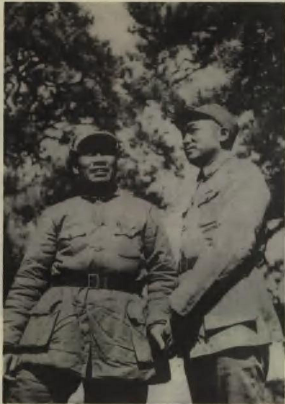
朱德总司令和彭德怀副总司令在晋东南抗日前线