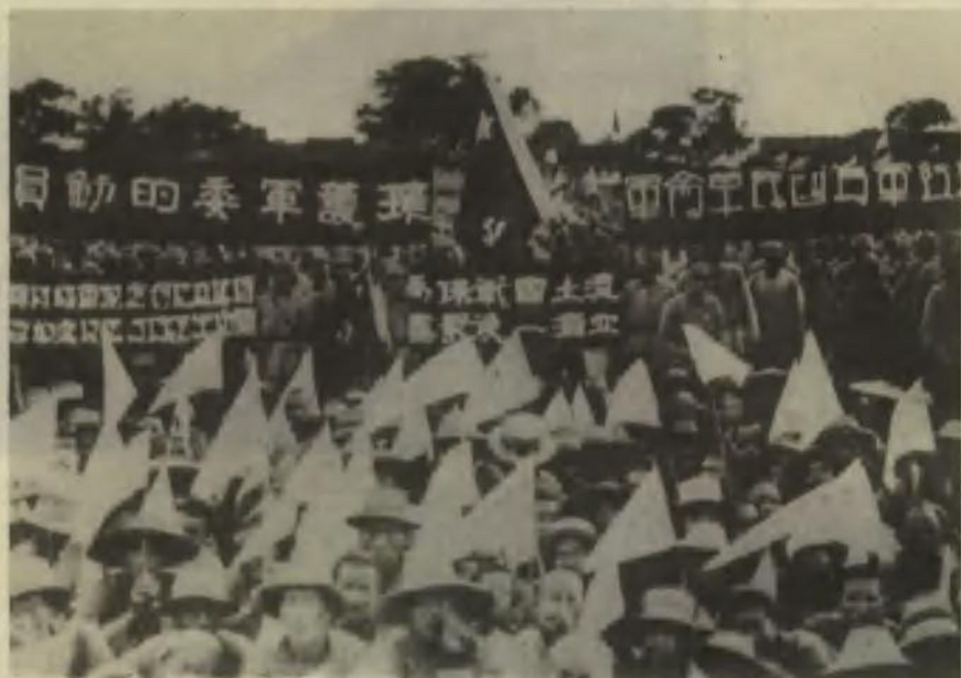
中国工农红军抗日誓师大会