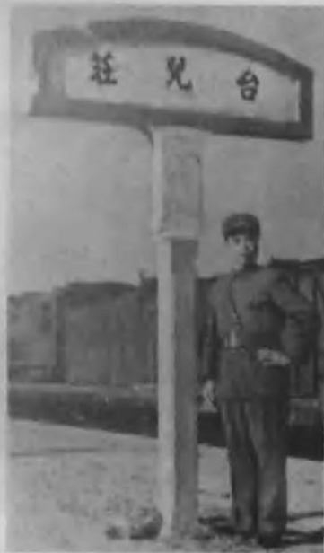
指挥台儿庄战役的中国军队第五战区司令长官李宗仁