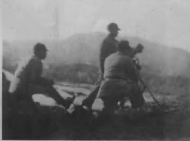
黄土岭战役我军迫击炮阵地