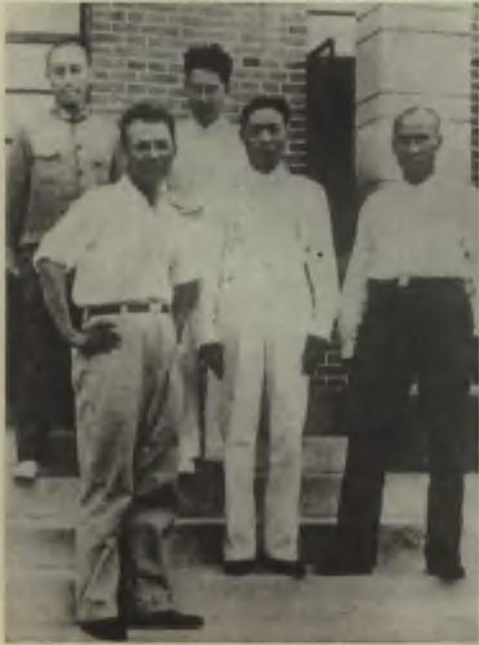
1937年8月，军委副主席周恩来、总司令朱德、参谋长叶剑英赴南京和国民党代表谈判。图为与黄琪翔等合影