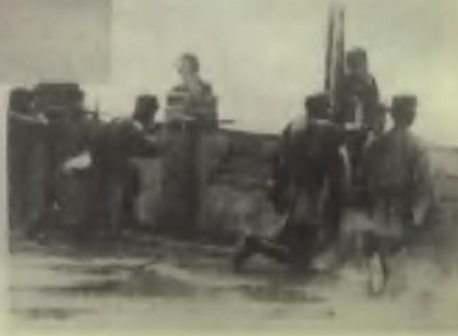
七七事变爆发时，芦沟桥中国守军奋起抵抗日本侵略军