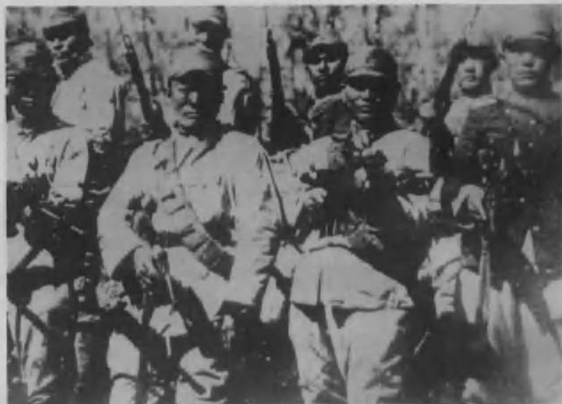
东北抗日联军第一路军警卫旅战士