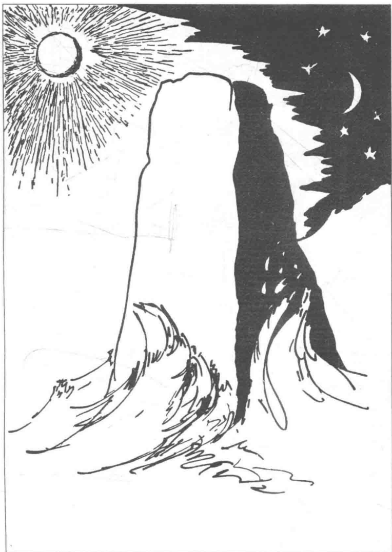
犹太人的创世故事