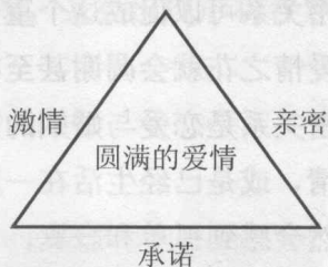
图 1-1 爱情三角形

值得庆幸的是，近几十年来关于爱情的研究越来越受到重视，许多社会科学家开始倾注精力研究婚恋问题，每年都有上百本关于爱情与婚姻的专业论文和书籍出版，很多成果都是来自科学的实证研究。对于爱情的探究已不再是诗人、哲学家和智者的“专利”。在众多关于爱情要素的研究中，最重要的理论成果出自于美国耶鲁大学的心理学家罗伯特·斯腾伯格 (Robert Sternberg)，他是这个新兴研究领域里的先锋人物。1986年，斯腾伯格教授提出了著名的“爱情三元论”。他认为，人类的爱情虽然复杂多变，但基本上包含三个主要成分，即激情、亲密和承诺。在构建该理论模型时，斯腾伯格对每一个成分给予了清楚的诠释，并且用三角形来表示爱情的结构。如图 1-1 所示，三角形的三条边代表爱情的三个成分，三者合为一体便组成了圆满的爱情。这一“三角形模式”是迄今为止最卓越的爱情理论之一，它可以很好地描述和解释人世间纷繁变化的爱情形态。