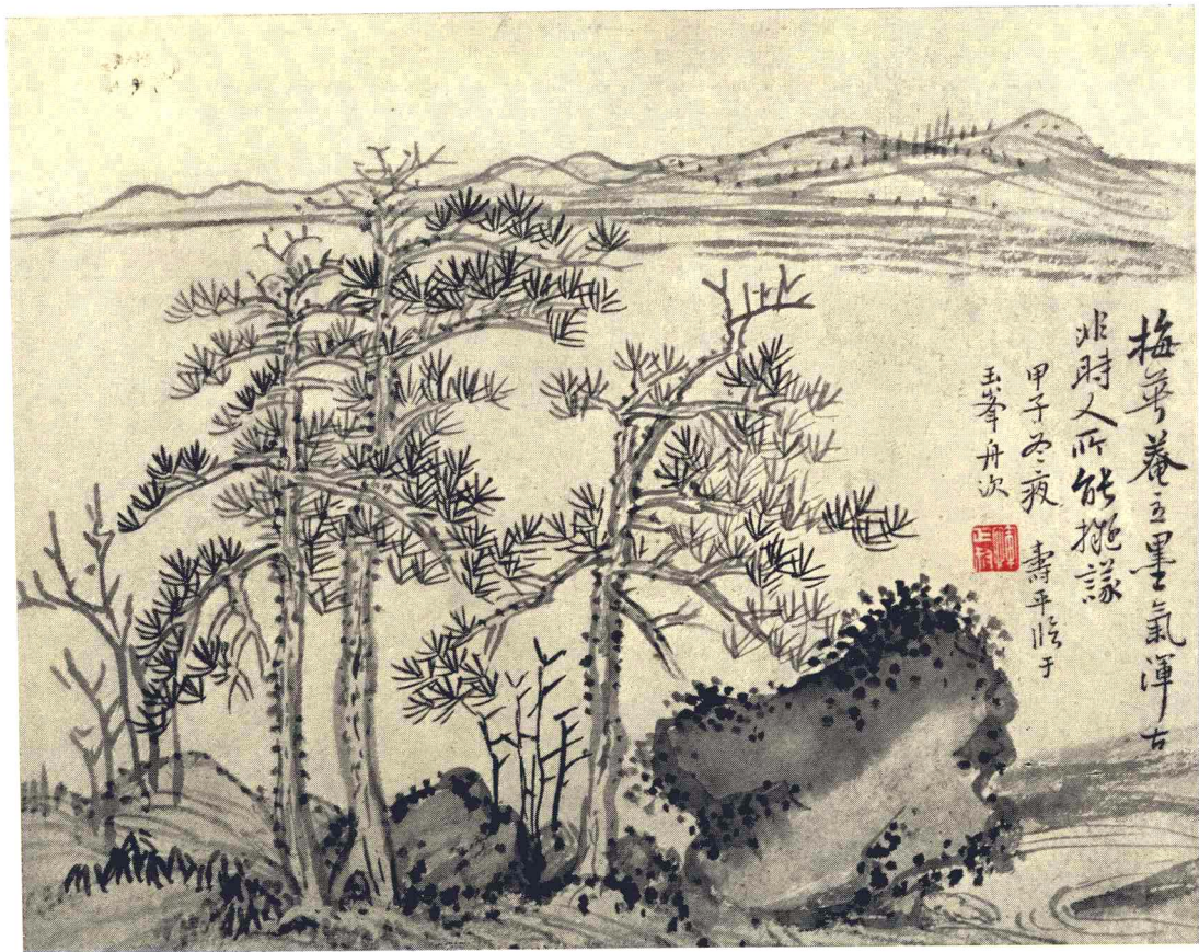
清 恽寿平 仿古山水册（十二开）之十二