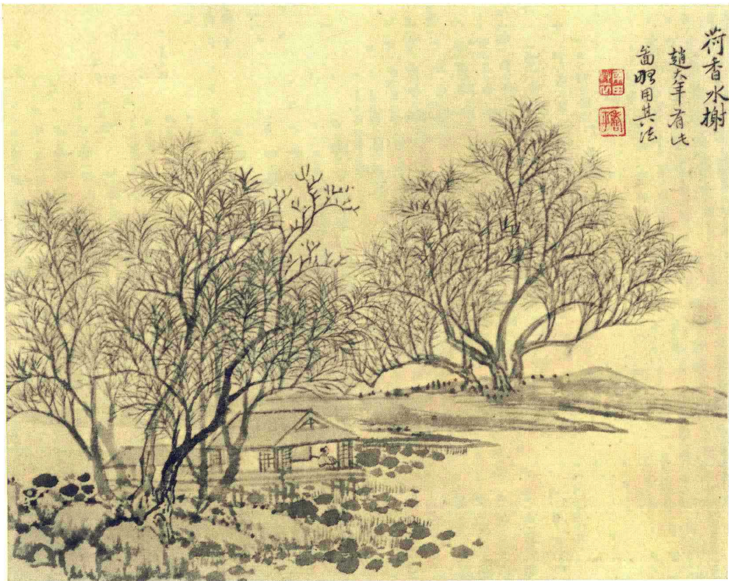
清 恽寿平 仿古山水册（十二开）之五