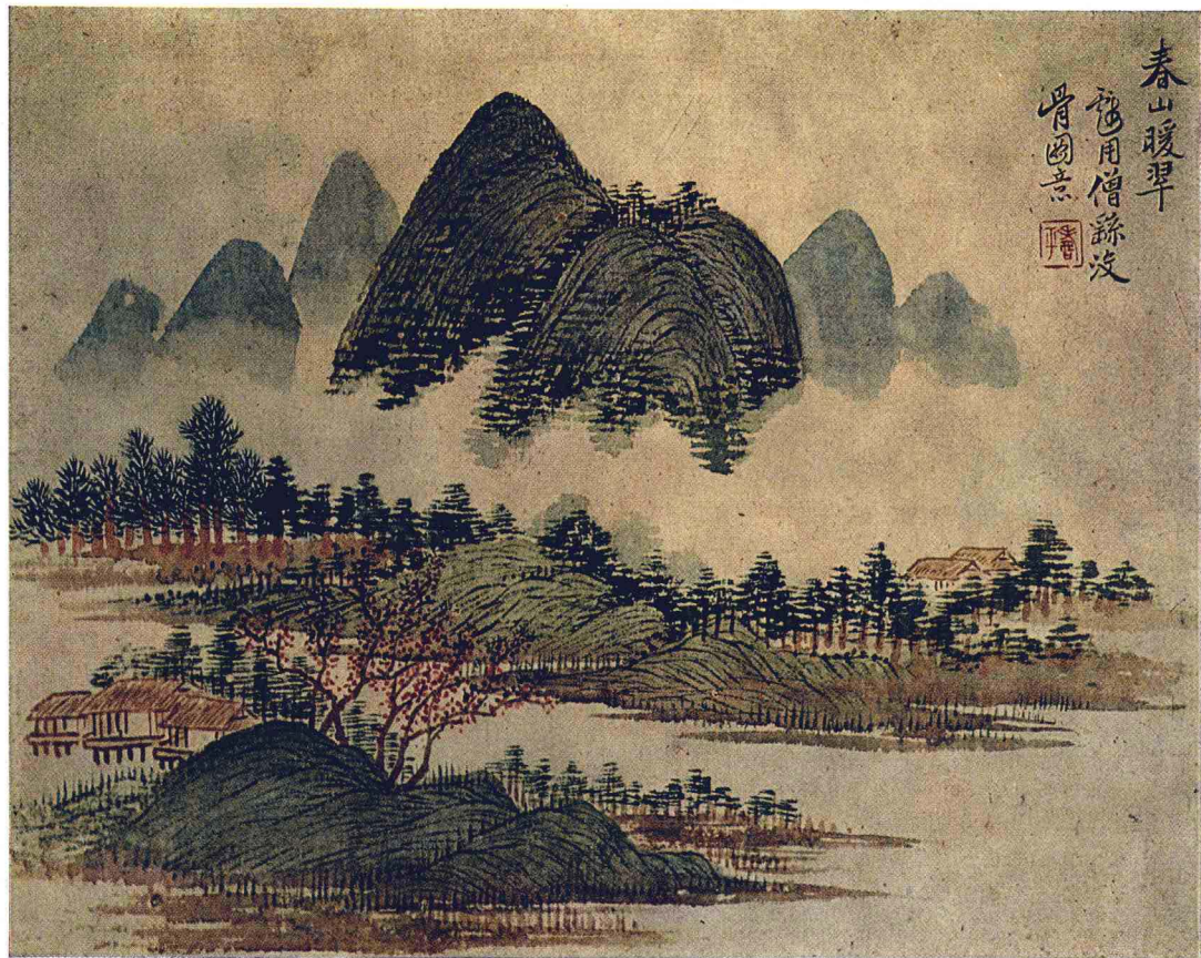
清 恽寿平 仿古山水册（十二开）之一