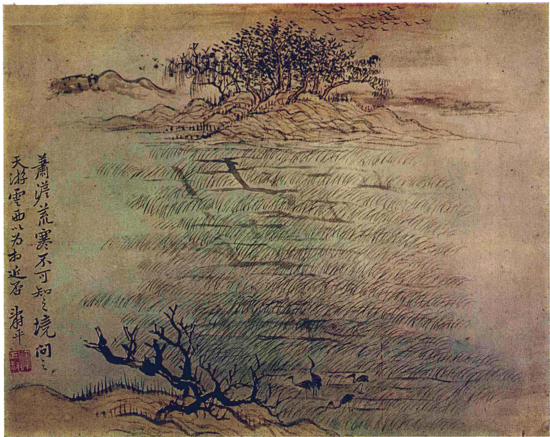
清 恽寿平 仿古山水册（十二开）之十一