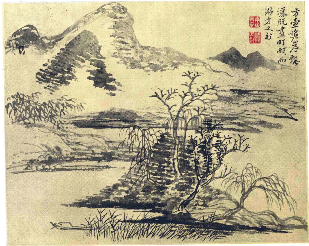
清 恽寿平 仿古山水册（十二开）之七