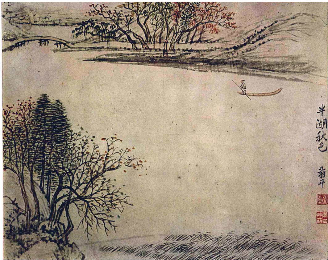
清 恽寿平 仿古山水册（十二开）之六