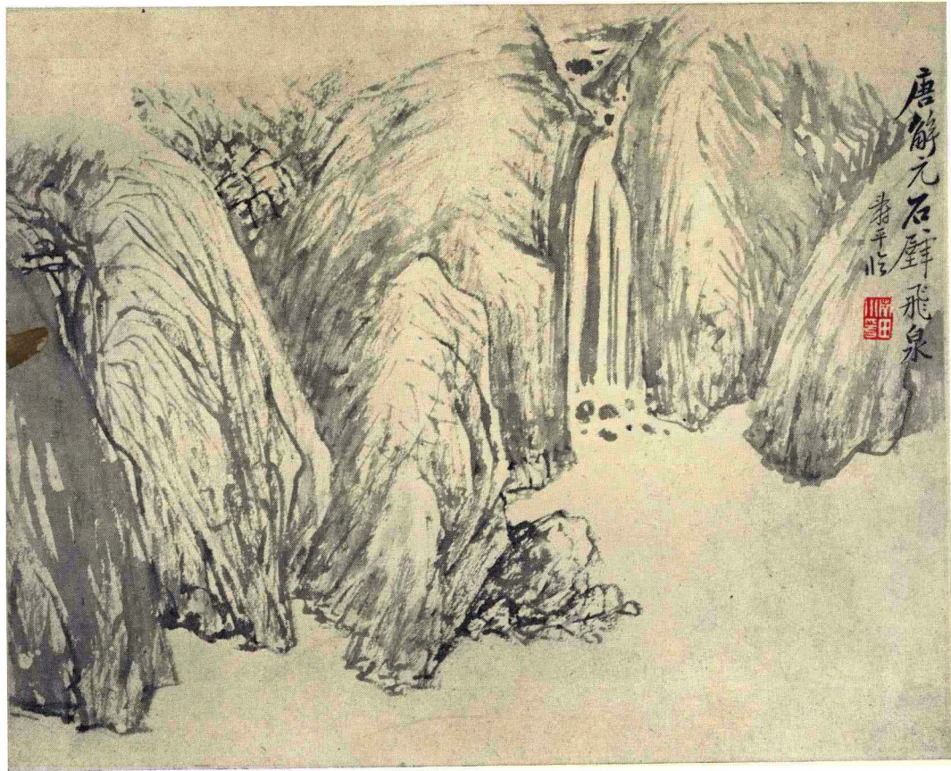
清 恽寿平 仿古山水册（十二开）之四