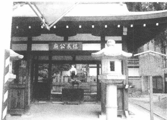
本能寺：本能寺是织田信长因部下明智光秀叛变而被杀的处所，今其寺中有信长公庙。

江户幕府是建立在日本战国时代以来的变革基础之上的，战国时代的“革命者”，首推织田信长，后人评价说“其卓见使日本得吸世界之新空气，以资益其将士之智能，以涵养日本勃兴之渊源” ① 。而丰臣秀吉作为信长的继承人，他和信长一起成为战国时代变革的集大成者。其后的江户时代在很多地方都可以找到战国和织丰政权时代留下的影子。