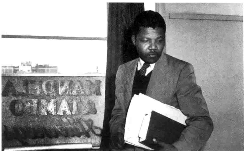
1952年，曼德拉在他与奥利弗·塔博开办的律师事务所办公室，那是约翰内斯堡第一家黑人开办的律师事务所。