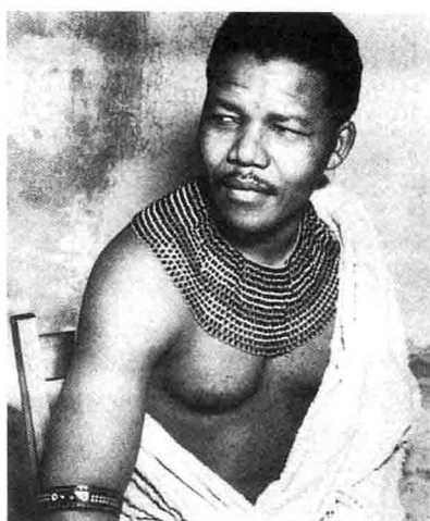
身着考撒传统民族装的曼德拉