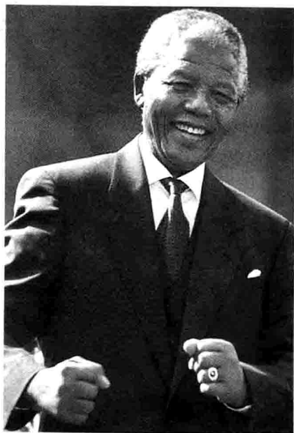
打不倒的勇者：曼德拉