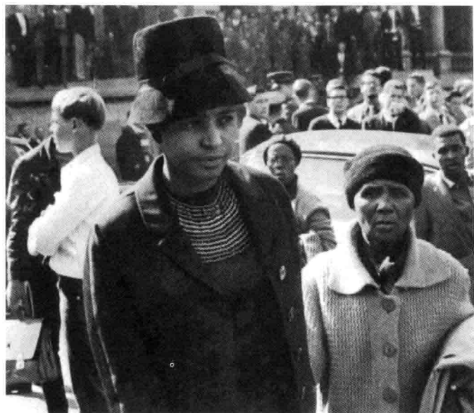
温妮与曼德拉的母亲