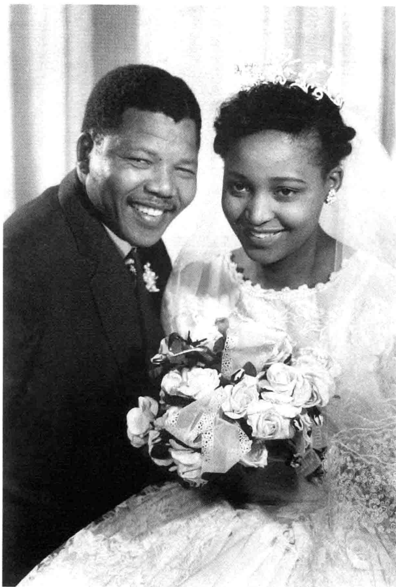
曼德拉与温妮结婚照（1958年）