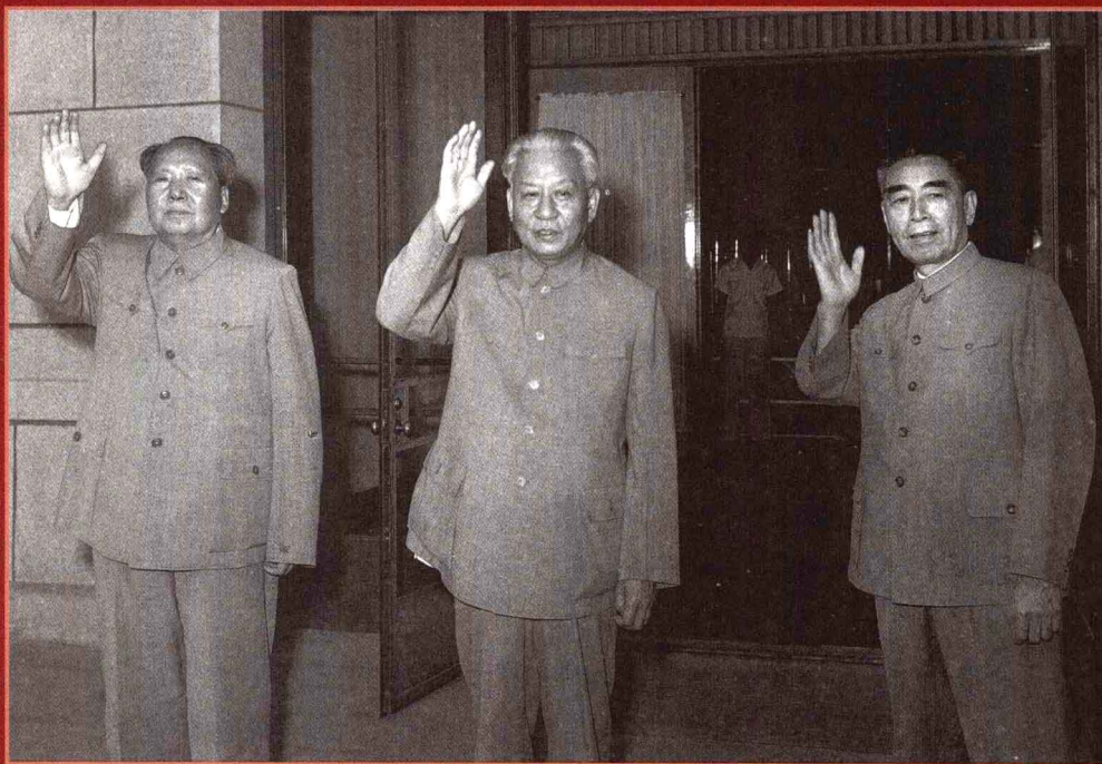
毛泽东与刘少奇、周恩来在人民大会堂门前挥手送别客人。