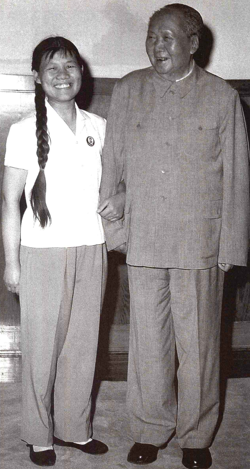
1970年，毛泽东在人民大会堂与服务员合影。