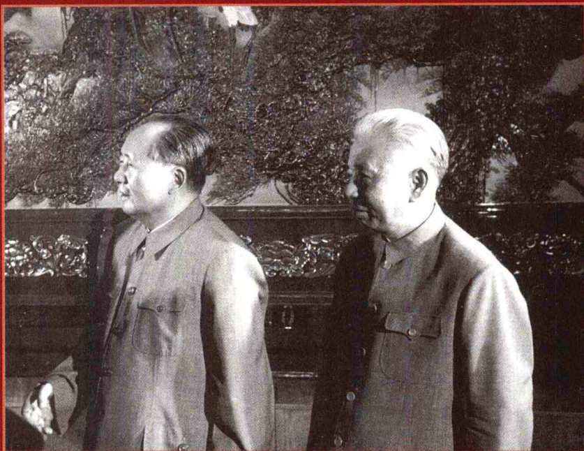
毛泽东和刘少奇在一起。