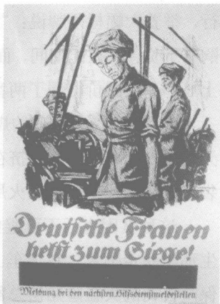
德国战争海报，“德国妇女，为了胜利而工作！”

在全德国，没到上前线年龄的中学生——考虑到他们将来总会出发——必须参加高强度的准备性军事训练。有时候，他们甚至作为非正规士兵被编入到军队各部。从16岁起，他们就可能被送上前线。年轻的布莱希特的形象可能显得有点让人吃惊，但这形象与时代是相符的：在他所出生的巴伐利亚州奥格斯堡市，他像同学们一样，被布置到民防队里，还在当地报刊上发表了一些爱国诗作，而且，他是最认真地投身于空中侦察的人。