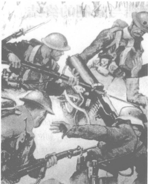
1917年美军参战，图为美军士兵端起刺刀，冲上德军的一个机枪阵地。

士兵数量自1914年以来增长了三倍还多，几乎达到1000万人。在各工业部门，工人数量则减少了1/4，而女工人数增长了一半。手工劳动主要被用于维修或建造战争器材。相反，在纺织和食品工业部门，手工劳动降到60%。整个国家都变了，很快便陷于经济与社会的不平衡之中。