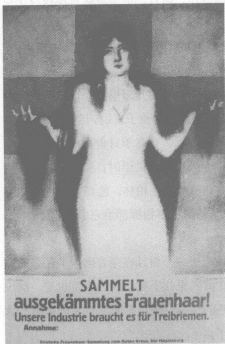
德国战争海报，“收集妇女梳掉的头发。”

士兵们的生活条件根据其前线、其所驻扎的地区的不同而有所差异。但城市居民也没什么可羡慕他们的。他们的内衣被清理品弄得缝缝补补、磨损旧毁、焦灼破烂，成了些褴褛布条。恶劣天气使制服和裤子褪了色，破烂不堪，补丁摞补丁。在优惠了参谋长、然后是军需处和厨房之后，对于军队里的人来说，生活物资就没再剩下什么东西了。人们争先恐后，希望能揩油弄