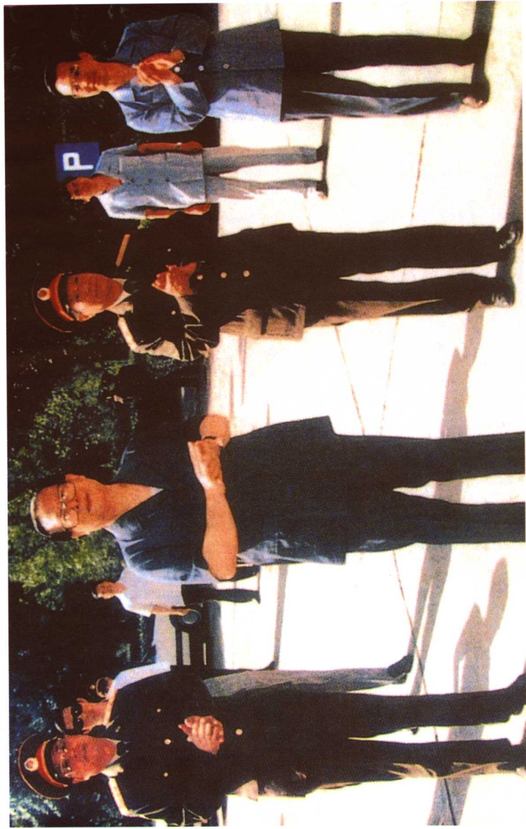
1993年6月15日，中央军委主席江泽民到陕西视察，接见武警陕西总队、武警技术学院师以上干部后作重要讲话，并为武警技术学院题词：“忠于党和人民，造就现代警官”