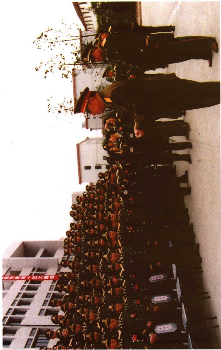
1997年10月25日，中央军委副主席迟浩田在武警上海指挥学校，接见参加教学改革革座谈会全体代表并作重要指示