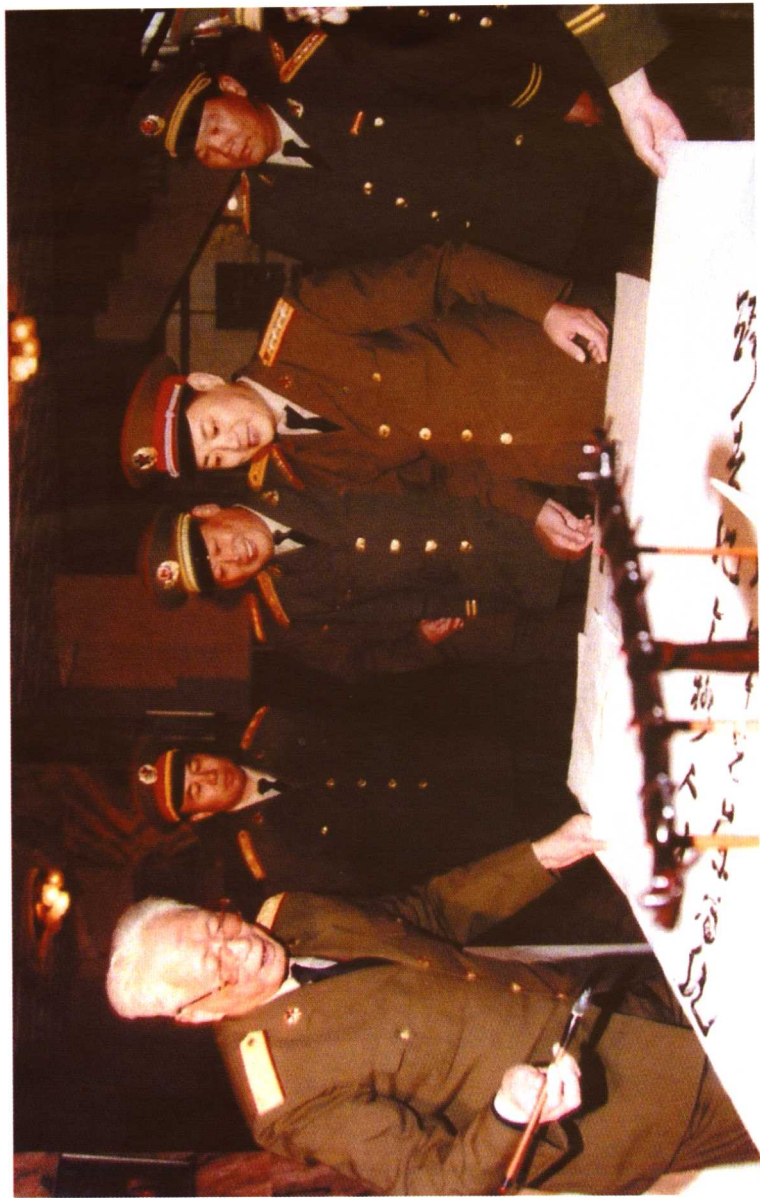
1996年11月5日，中央军委副主席张震给武警技术学院题词：“继承红军光荣传统，培养跨世纪合格人才”