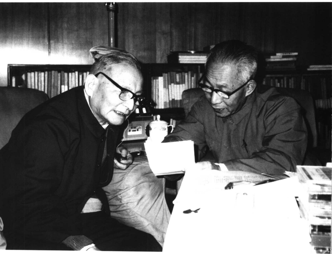
一九八三年，陳丕顯與陳雲(左)商談工作。此圖攝於陳雲家中。