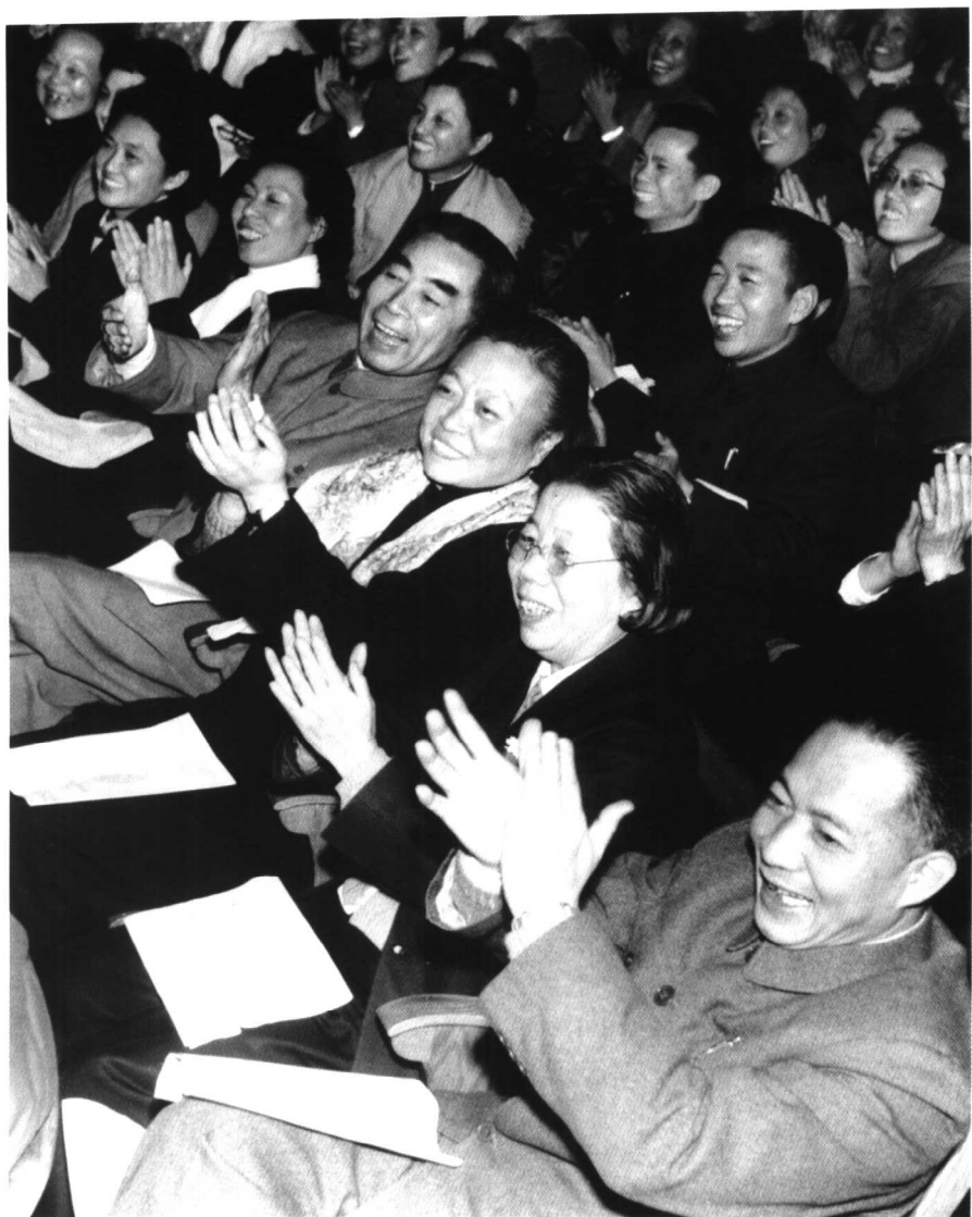
一九六三年一月三十日，陳丕顯(右一)、謝志成(右六)陪同周恩來(右四)、鄧穎超(右二)在上海市各界婦女春節聯歡晚會上。