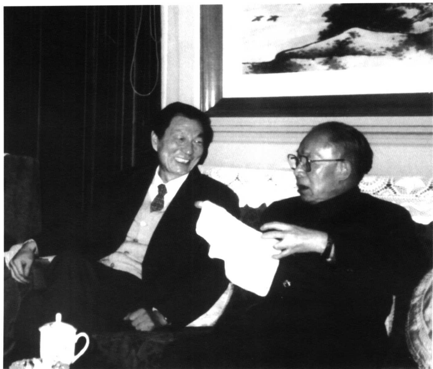
一九八八年，陳丕顯與朱鎔基(左)在上海。