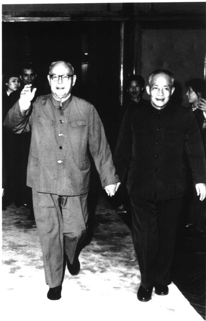
一九七九年，陳丕顯和葉劍英在湖北武漢。