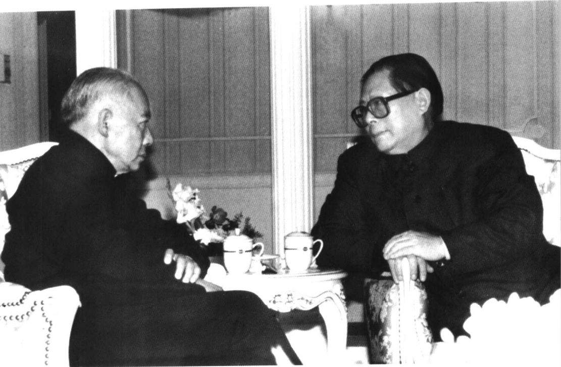
一九八九年十二月，陳丕顯與江澤民在廈門。