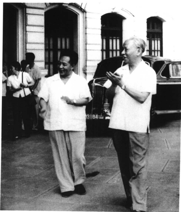
一九六四年，陳丕顯陪同劉少奇在上海視察工作。