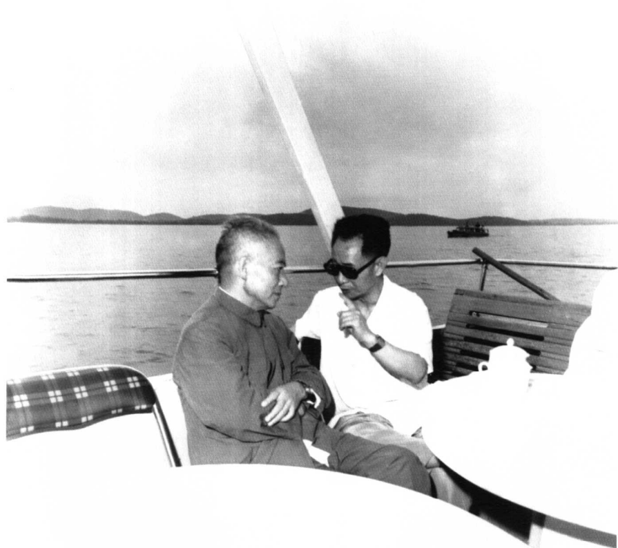
一九八零年，陳丕顯和胡耀邦(右)在武漢東湖游艇上交談。