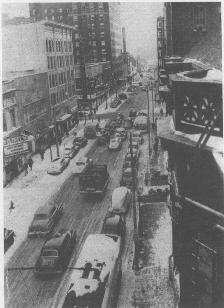
1930年代的美国城市街景，展示了当时的汽车和建筑风格。