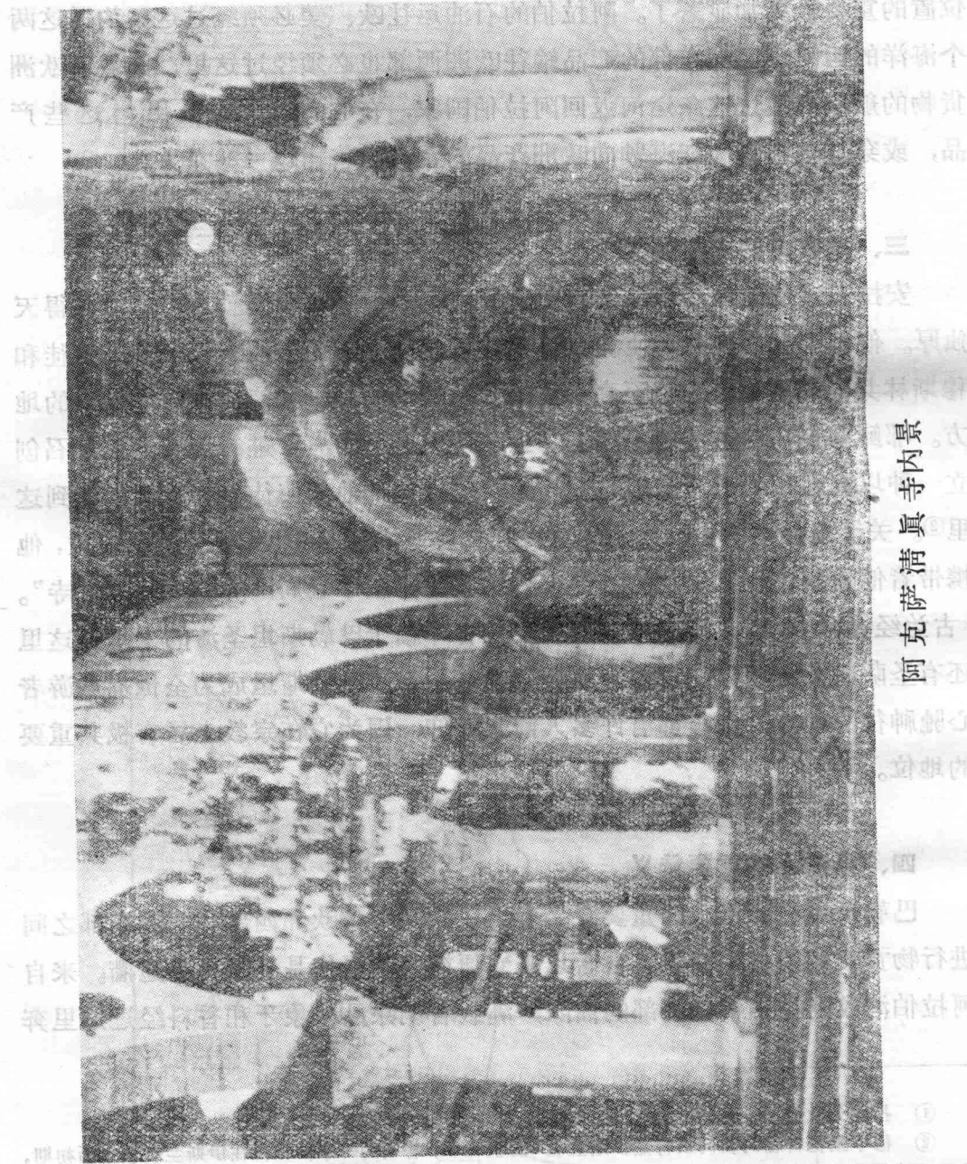
景內寺真清萨克阿