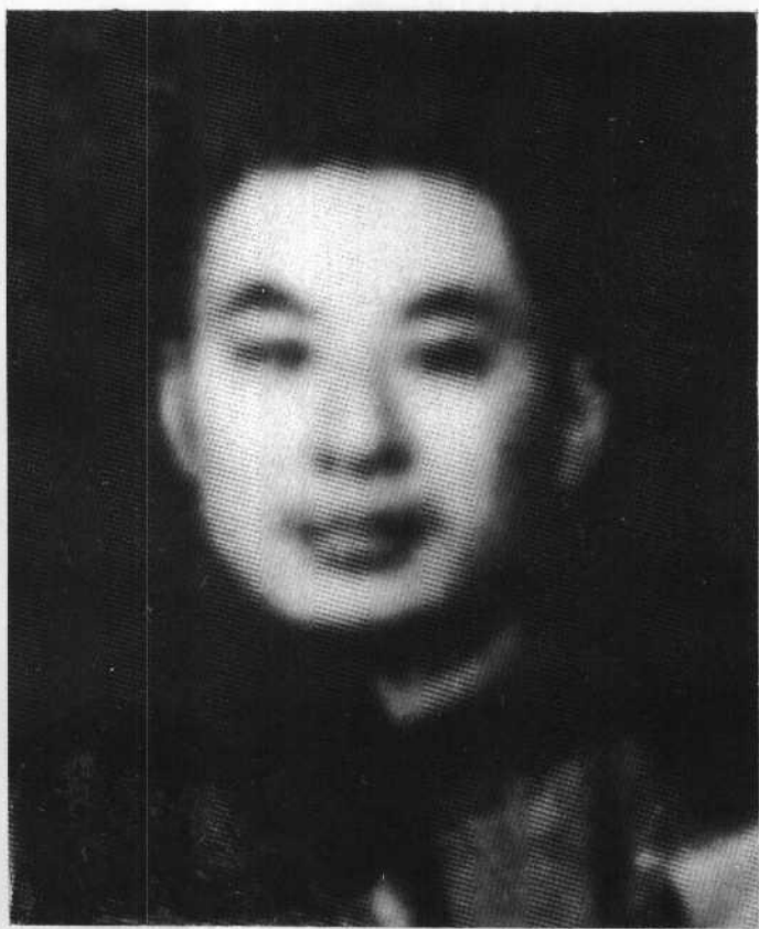
作者摄于一九三二年春。