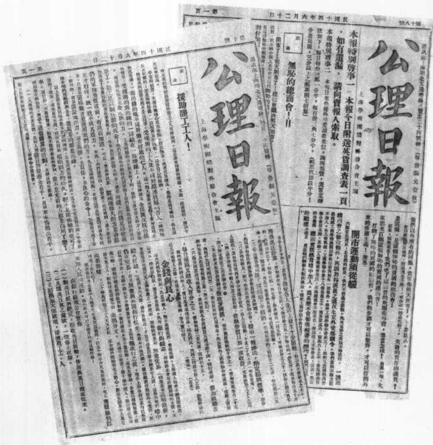
五卅运动期间的《公理日报》