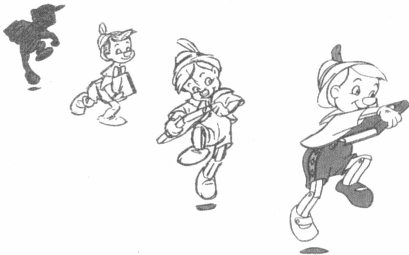
插图选自《迪士尼动画原则》(The Illusion of Life)